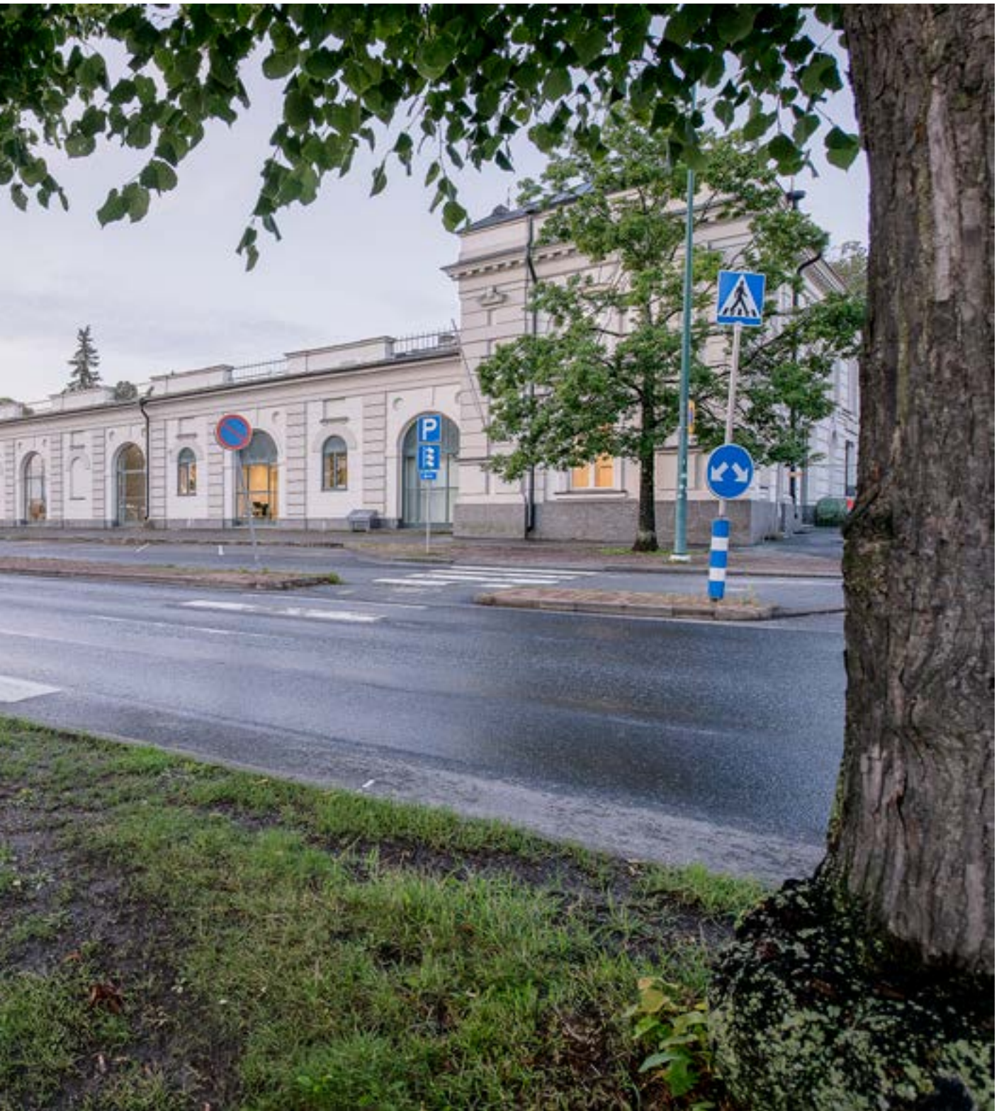
PORIN TAIDEMUSEO, TOIMINTAKERTOMUS 2022