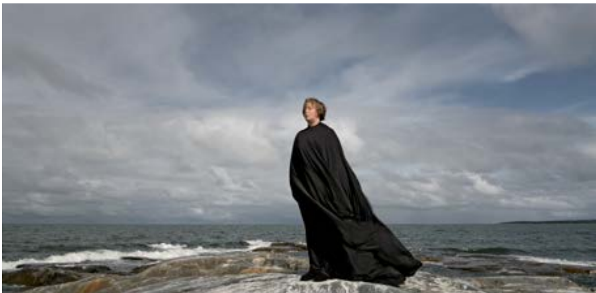
CHORUS SINENSIS Porin taidemuseossa 17.6.2022–25.9.2022