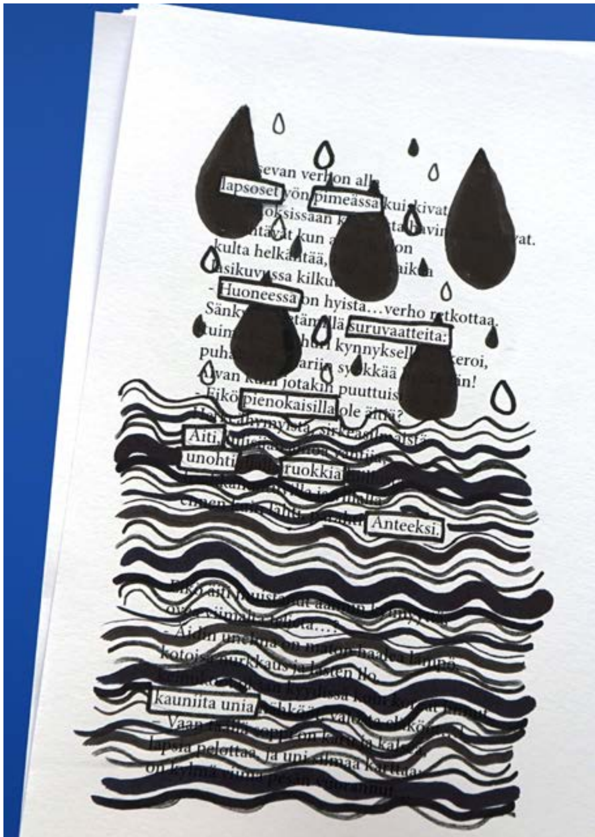
Muuttuva runo -työpaja kouluille.