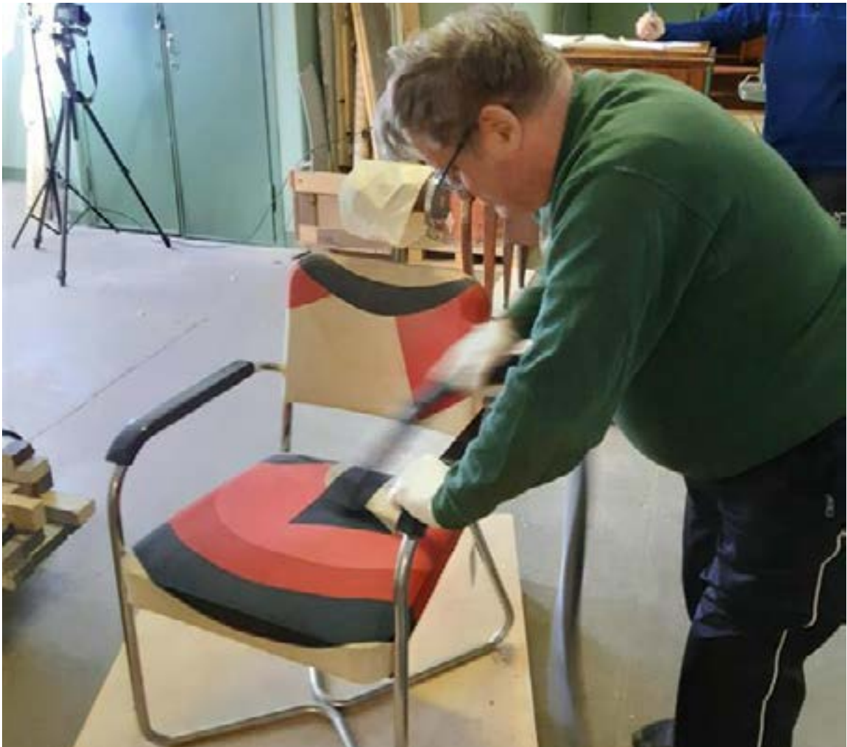
Satakunnan Museon ystävät Museoturvajoukko-koulutuksessa.