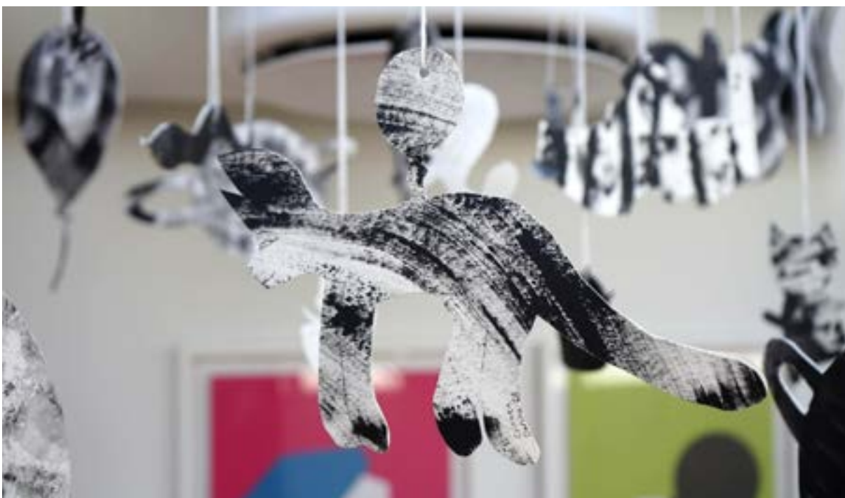
Lentäviä asioita -koululaistyöpaja.