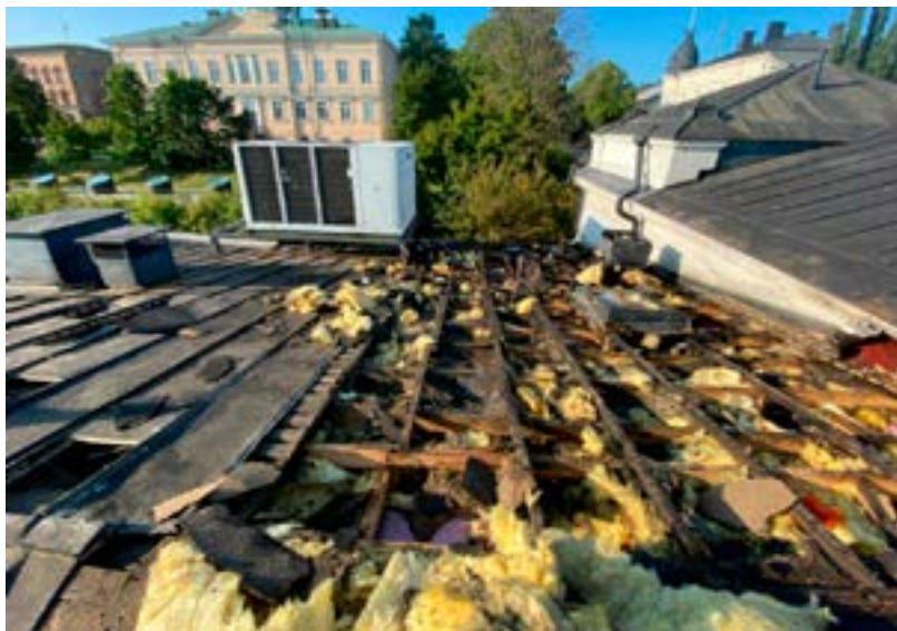
Yläpohjan palovahinkoalue.