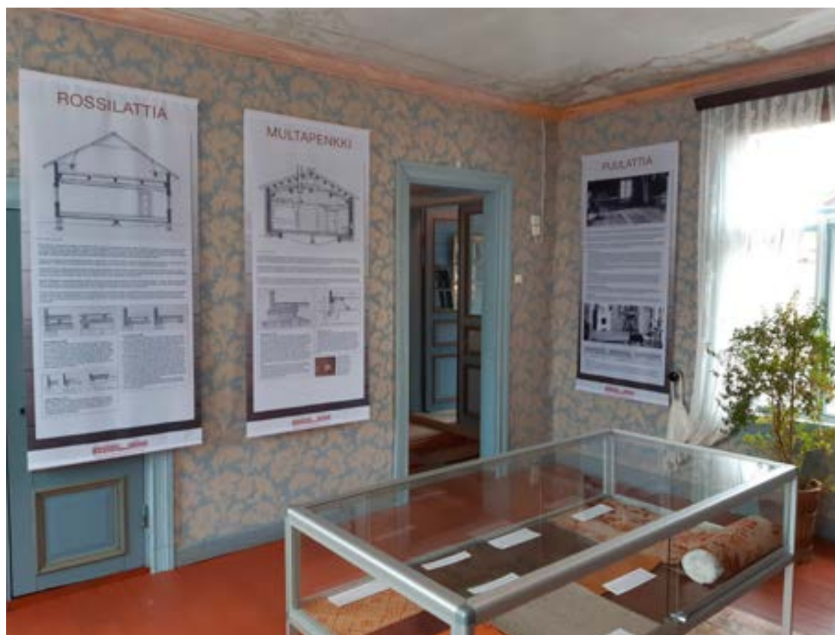
Lattia-näyttely Korsmanin talossa.