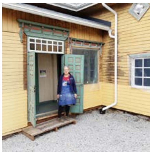
Euroopan kulttuuriympäristöpäivänä retkeiltiin Hinnerjoen kotiseutumuseossa, kirkossa, kyläkeskuksessa ja Pollarin talossa sekä Honkilahden Kolmhaaran muinaisjännösalueella.