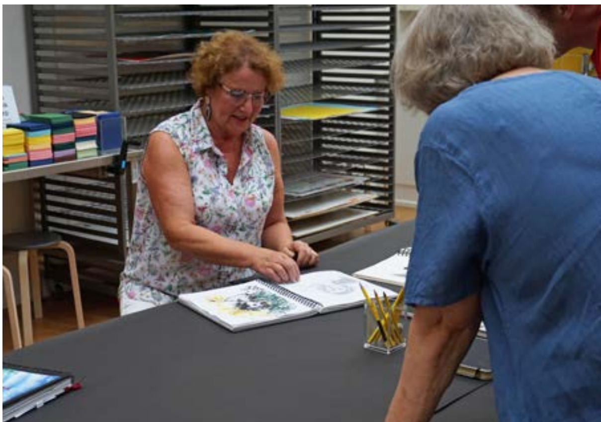
Piirrä koko kesä! -kurssi.