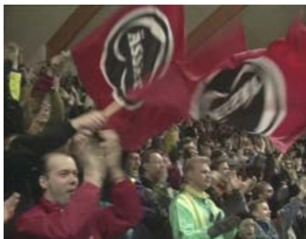
Still-kuvia 1990-luvun paikallistv-ohjelmasta