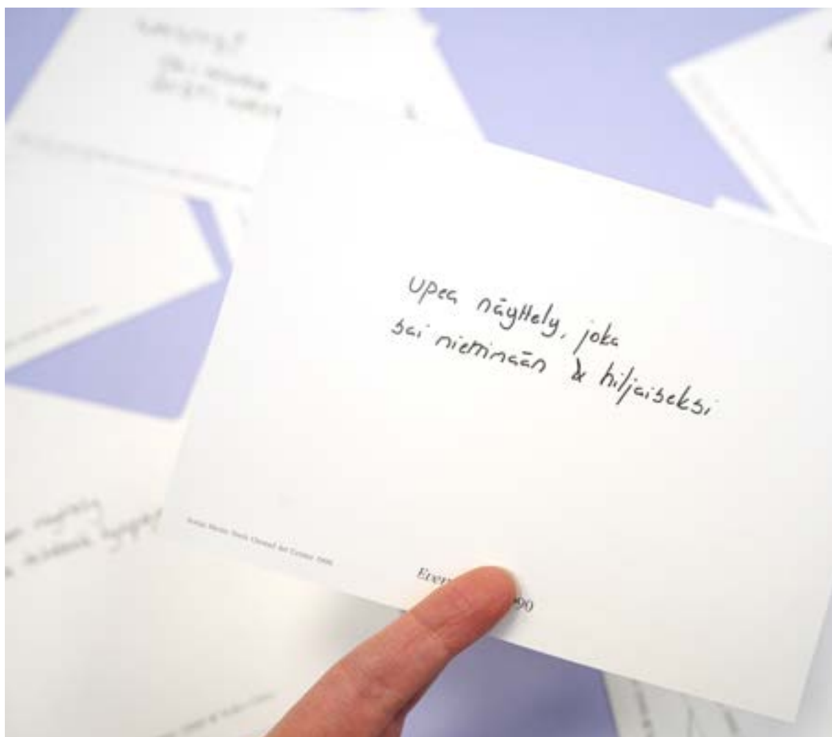
Asiakaspalautetta Porin taidemuseolle.