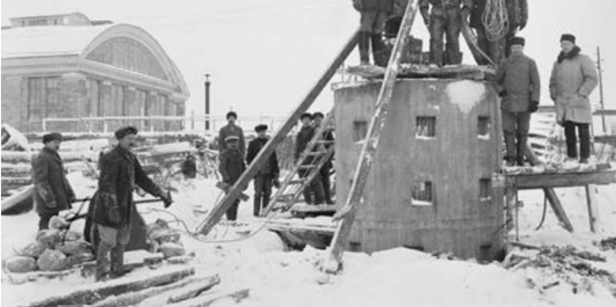
Sulfiittitehtaan piha ja sukelluspuku v. 1920.