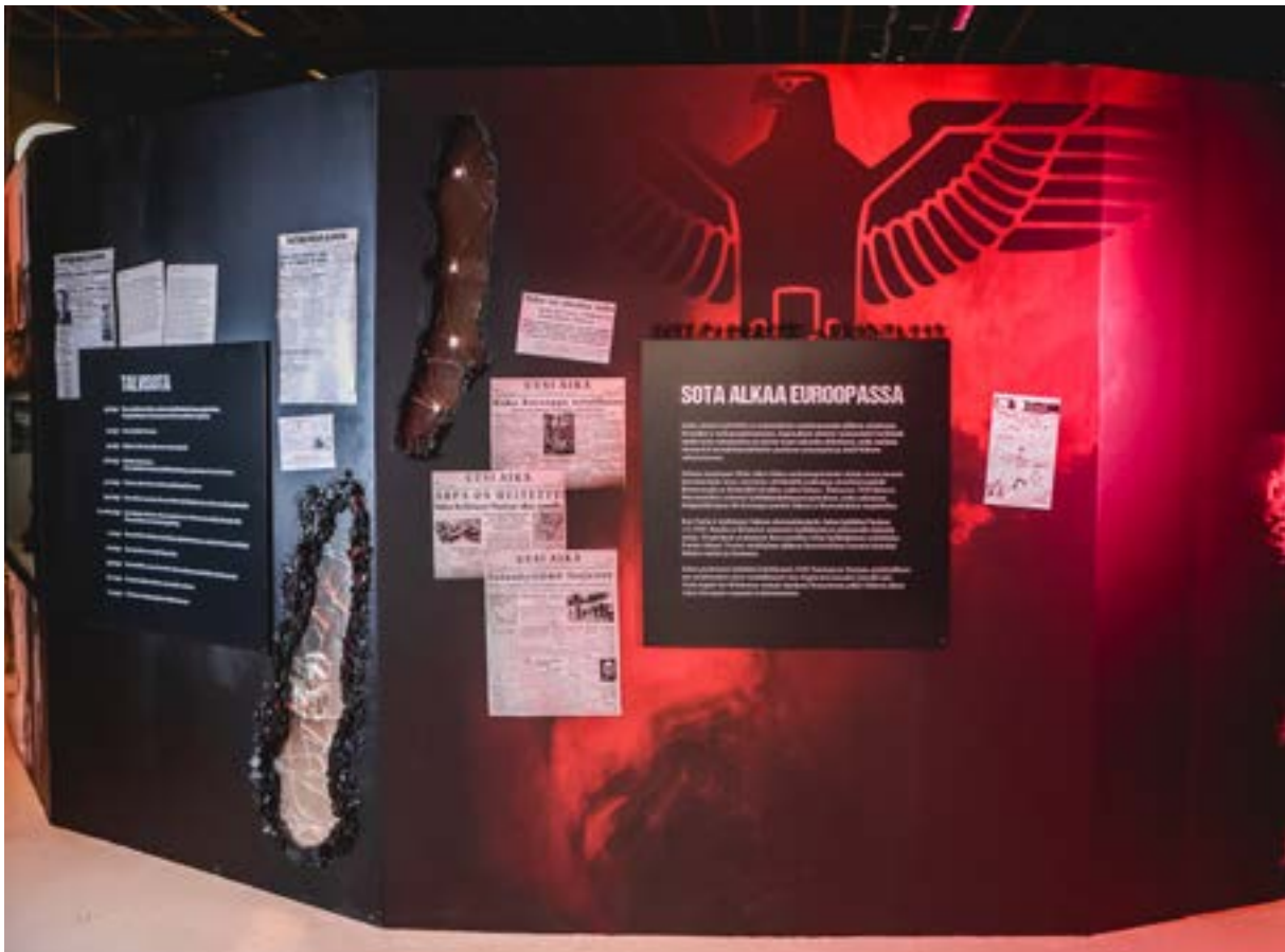
Satakunnan Museon Sota Porissa -näyttely. Museon sota-aiheisista näyttelyistä tuli järkyttävällä tavalla ajankohtaisia keväällä 2022.