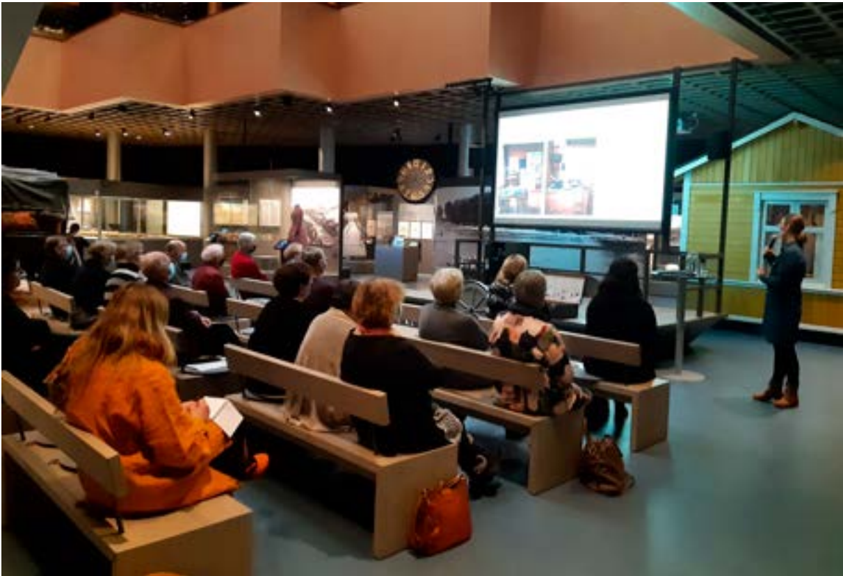
Maakunnallinen museopäivä 2022 Satakunna Museossa.