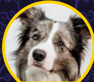
TikTok-koira Moska Meet & Greet

MUSIIKKIA TYÖPAJOJA PERFORMANSSIA PINSSIPAJA BUJOILUA