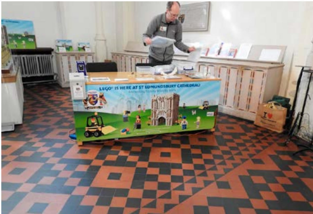
Vapaaehtoistyöntekijä keräämässä rahoitusta St. Edmundsbury'n katedraalin hoitoon. ErasmusPlus-hankkeen matka Englantiin.