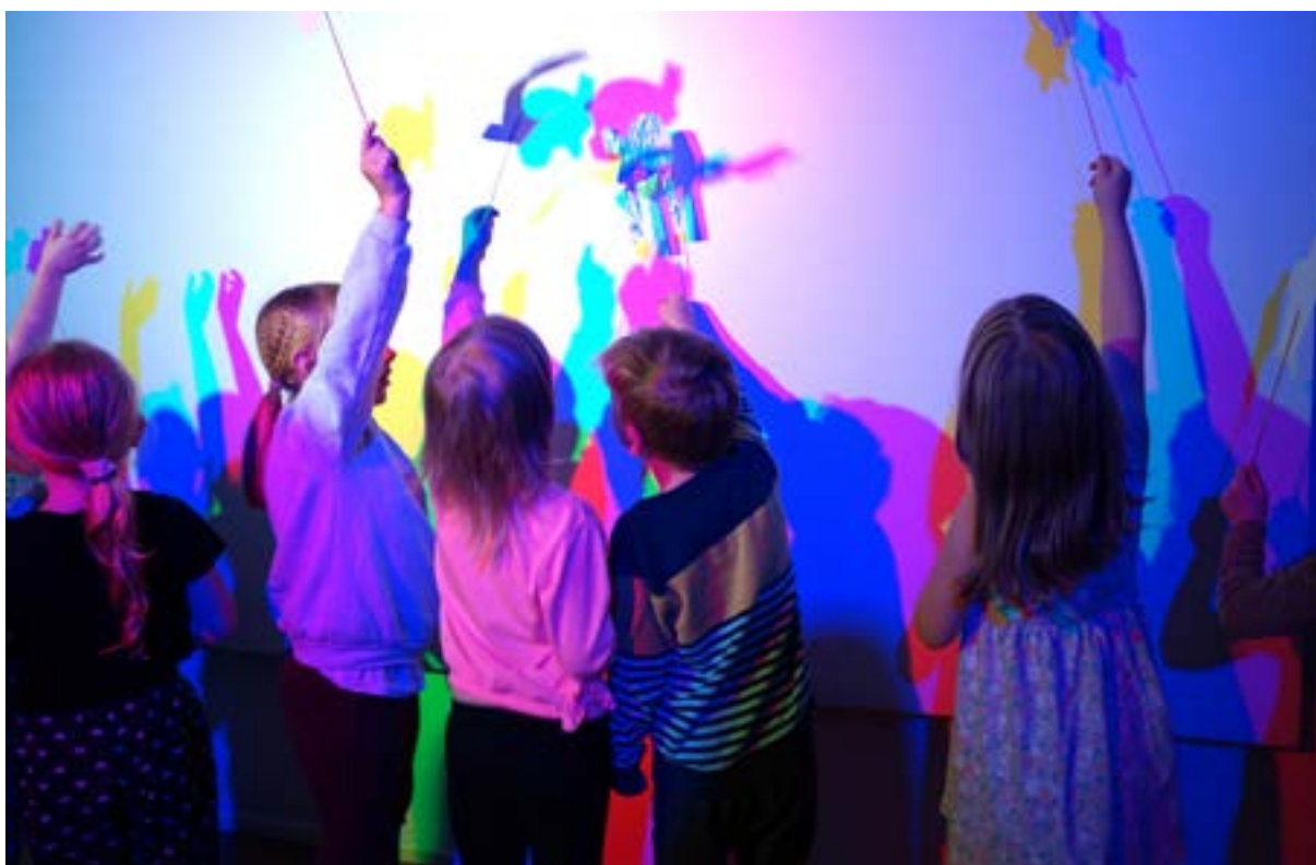
Varhaiskasvatuksen TAIDEmatka.