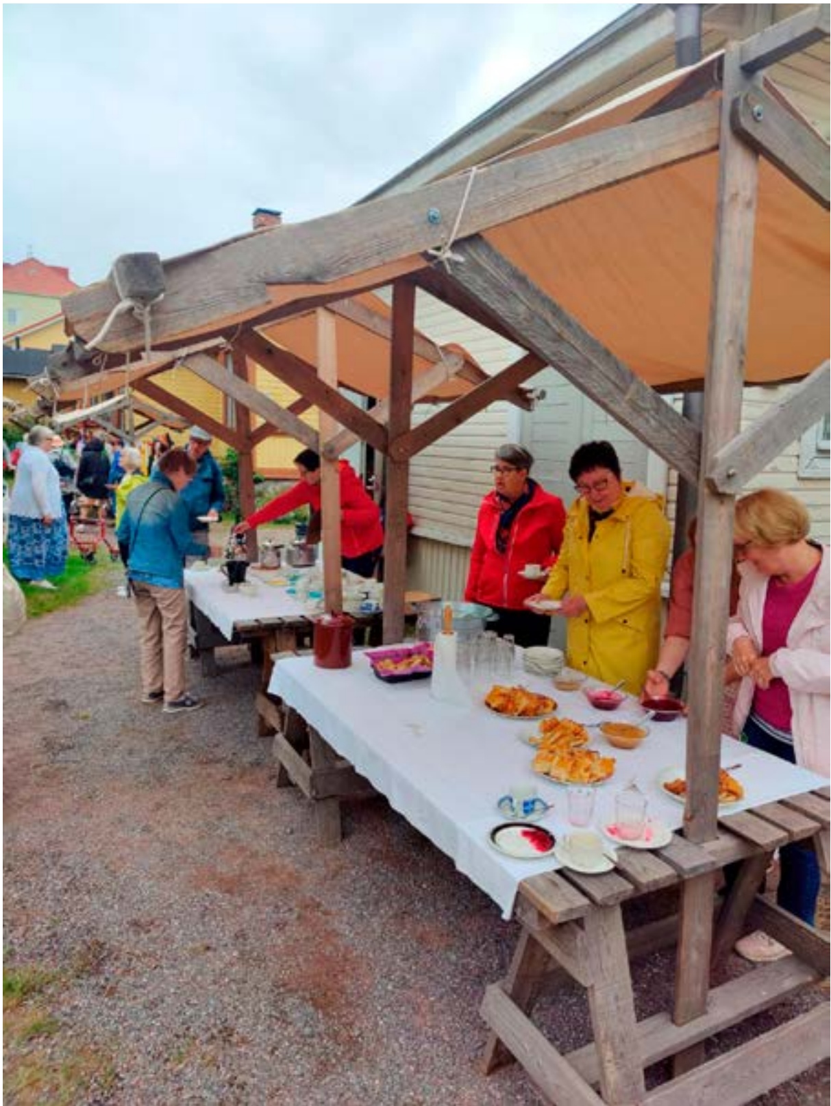
Rakennuskulttuuritalo Toivossa vietettiin juhannuksen alla jälleen perinteistä förskottijuhannusta.