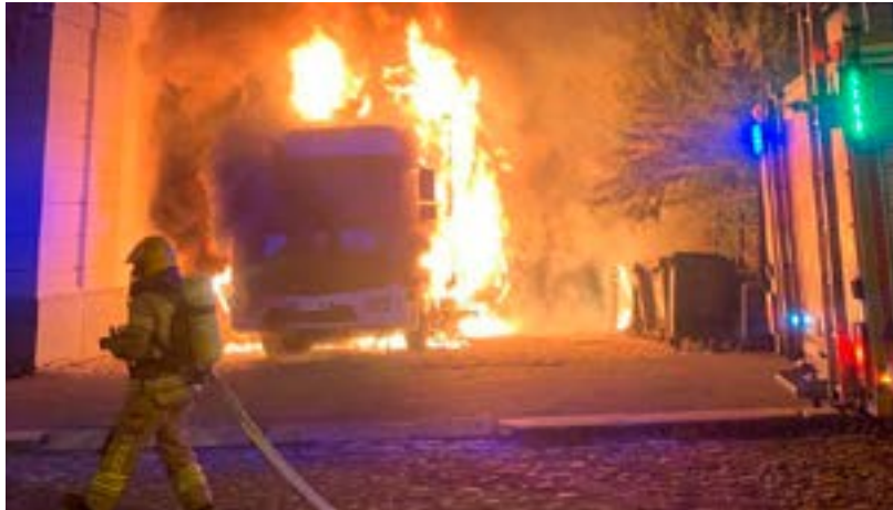
Alkutilanne, kun pelastuslaitos on saapunut kohteeseen.