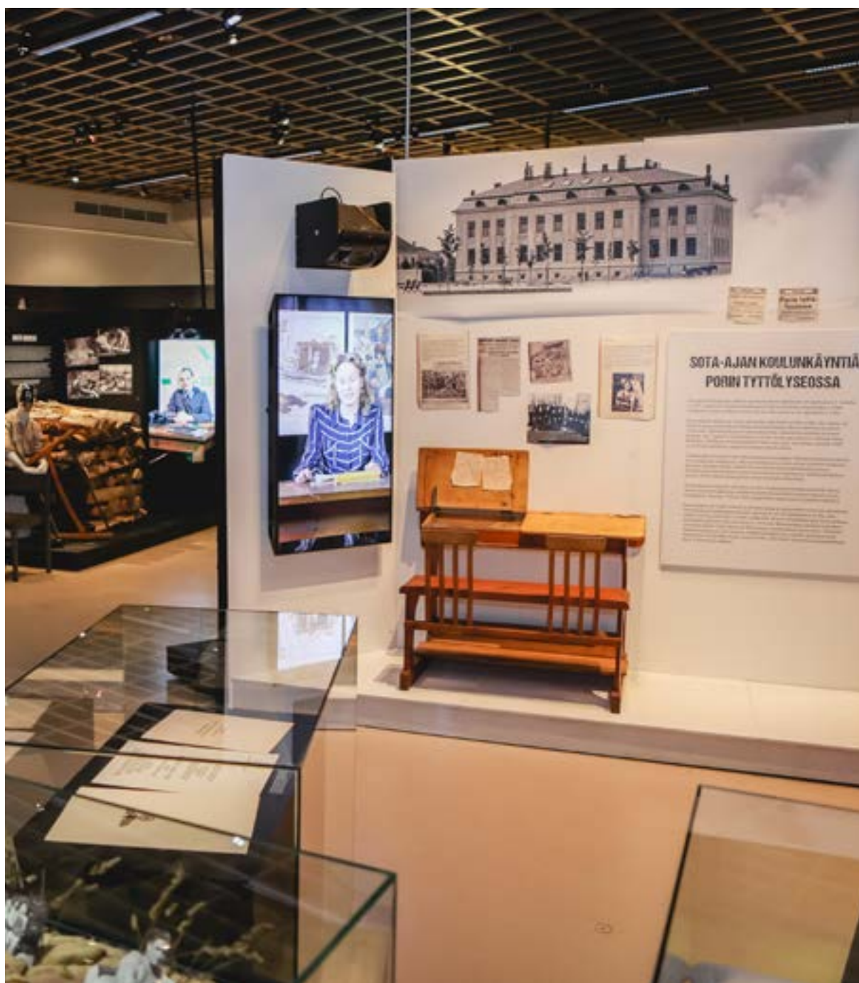
Sota Porissa -näyttely.