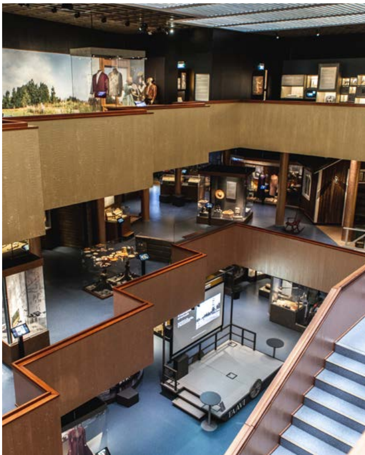
Elon merkkejä -näyttely.