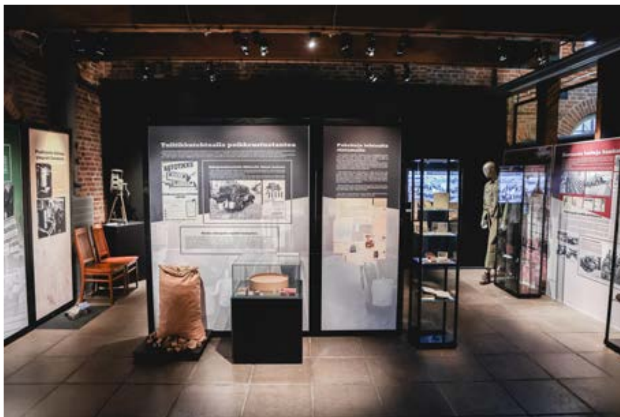
Rosenlew-museon Sodassa ja työssä -näyttely.