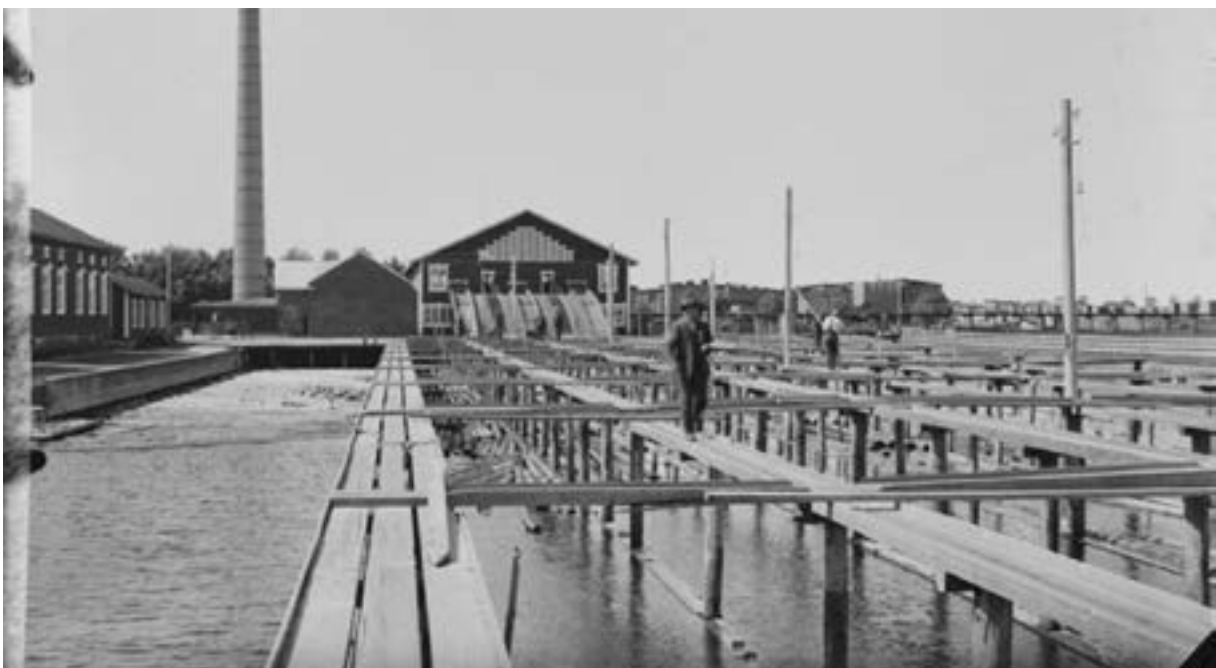
Seikunsaha v. 1911.