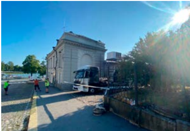
26.7.2021 aamulla, kun tulipalo on sammutettu.