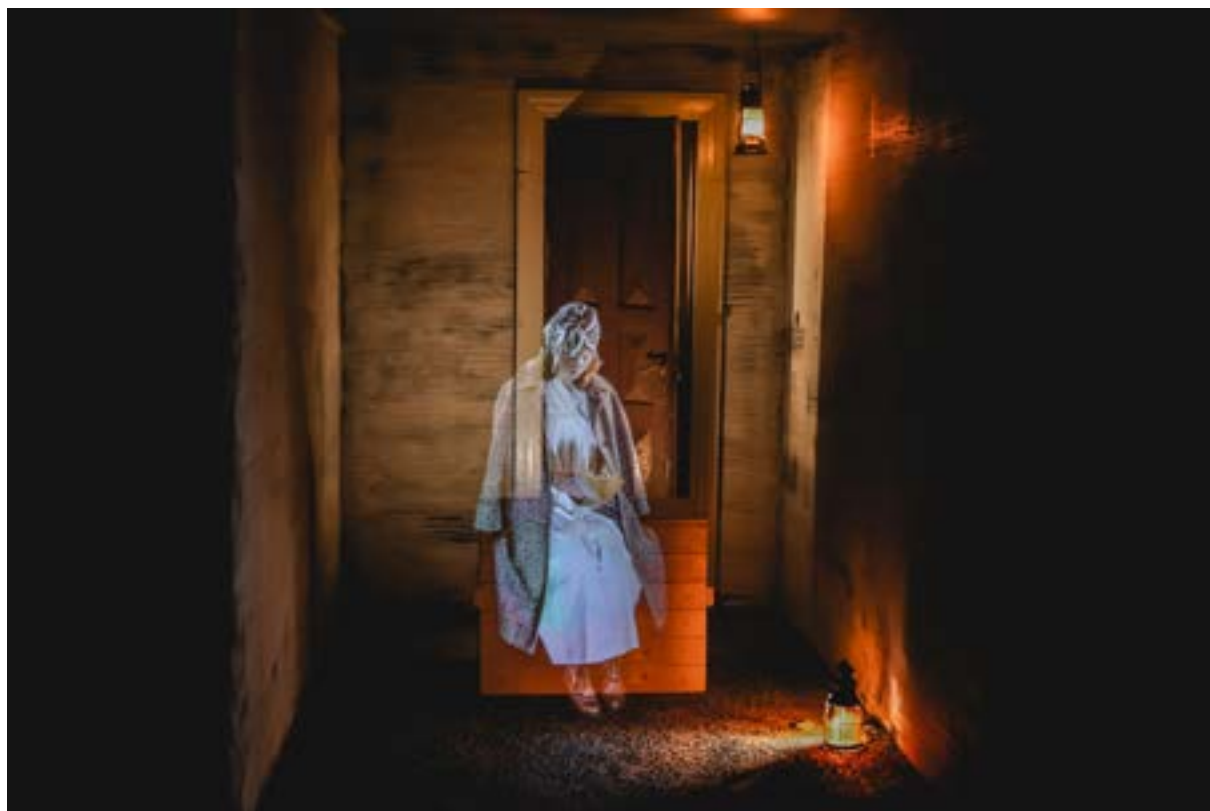
Satakunnan Museon Sota Porissa -näyttely.