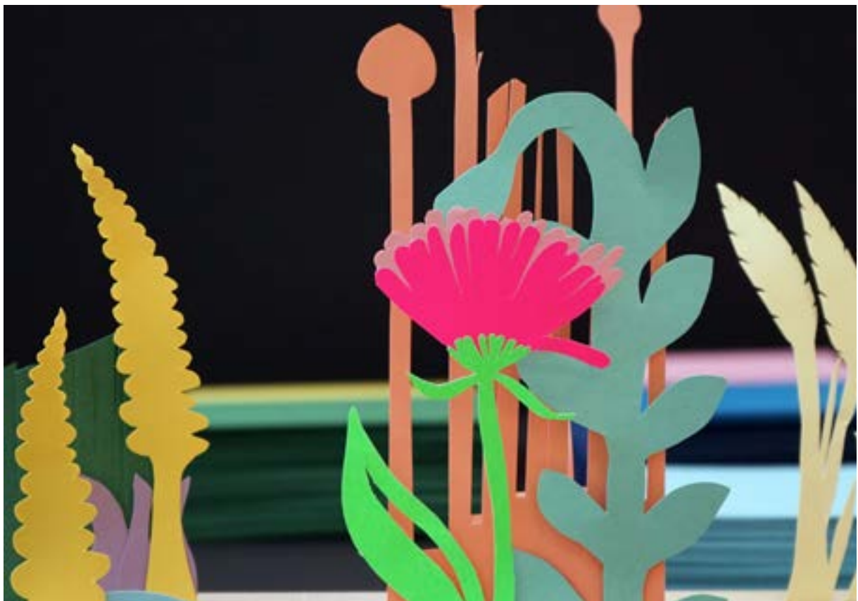
Villinä versova luonto -omatoimiyöpaja Porin taidemuseon työpajatilassa.