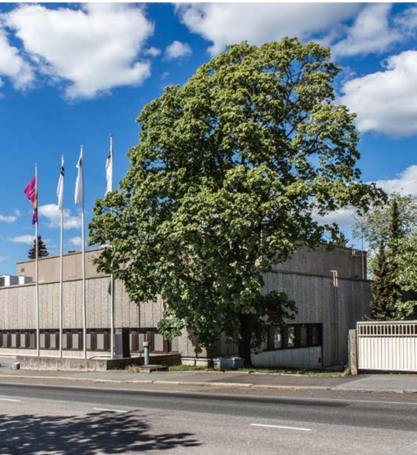
SATAKUNNAN MUSEO, TOIMINTAKERTOMUS 2022