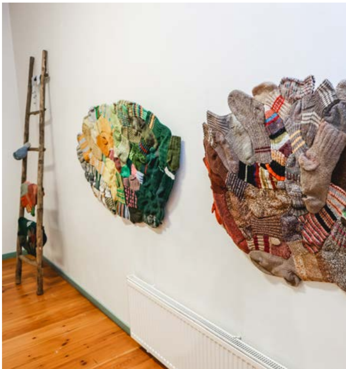
Kuvataiteilija Anu Tuomisen Honka, mänty, petäjä -näyttely Luontotalo Arkissa.