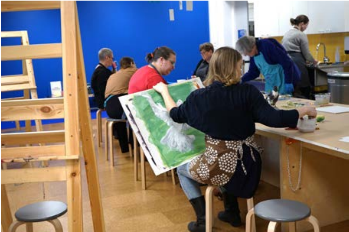
Opi taiteilijalta -työpaja.