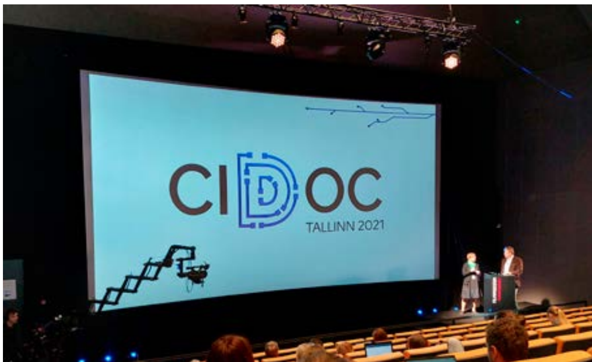
Cidoc-konferenssi Tallinnassa 2022.