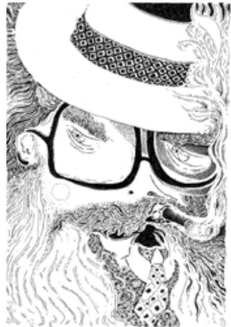
Salla Laurinoli, Väritettyä pimeyttä – testing light green