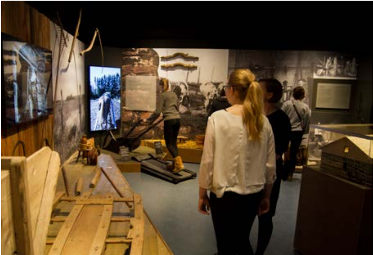
Kyntöhommia Satakunnan museon Elon merkkejä -näyttelyssä.