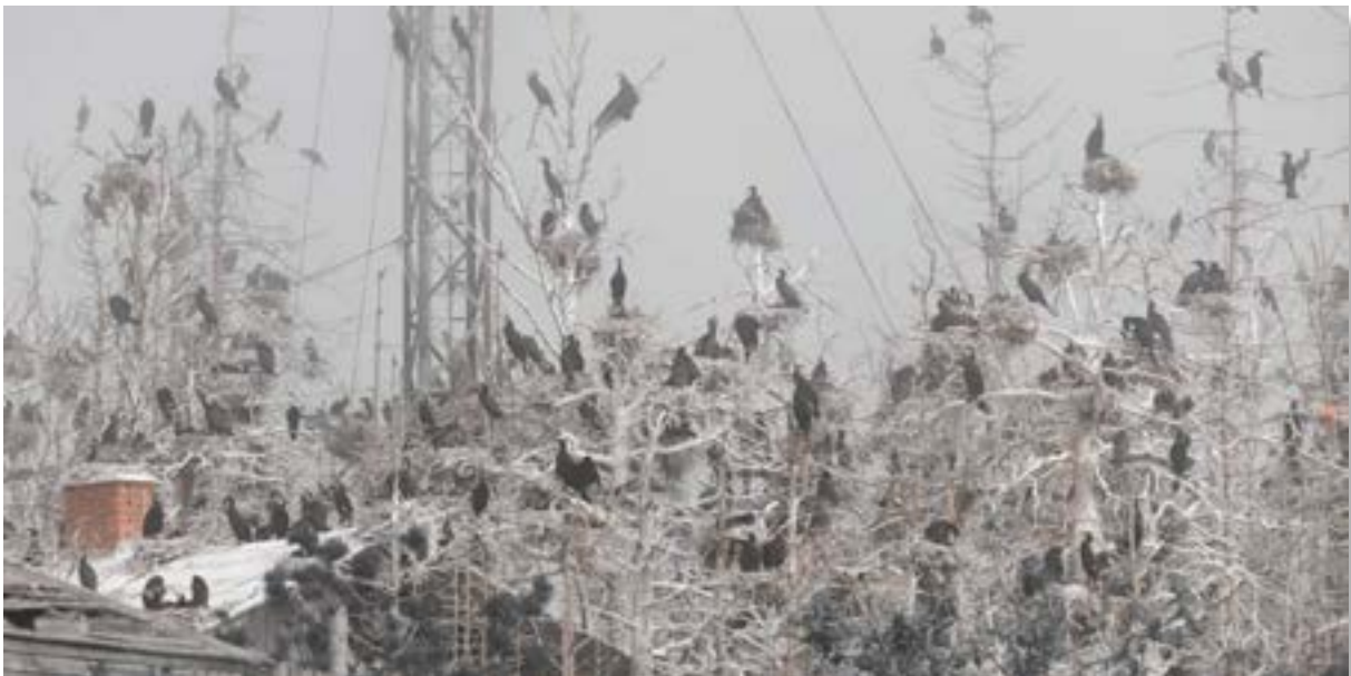
Chorus Sinensis -näyttelykatalogi. Toimitus ja graafinen suunnittelu Kati Kunnas-Holmström. Valokuvat Jan Eerala