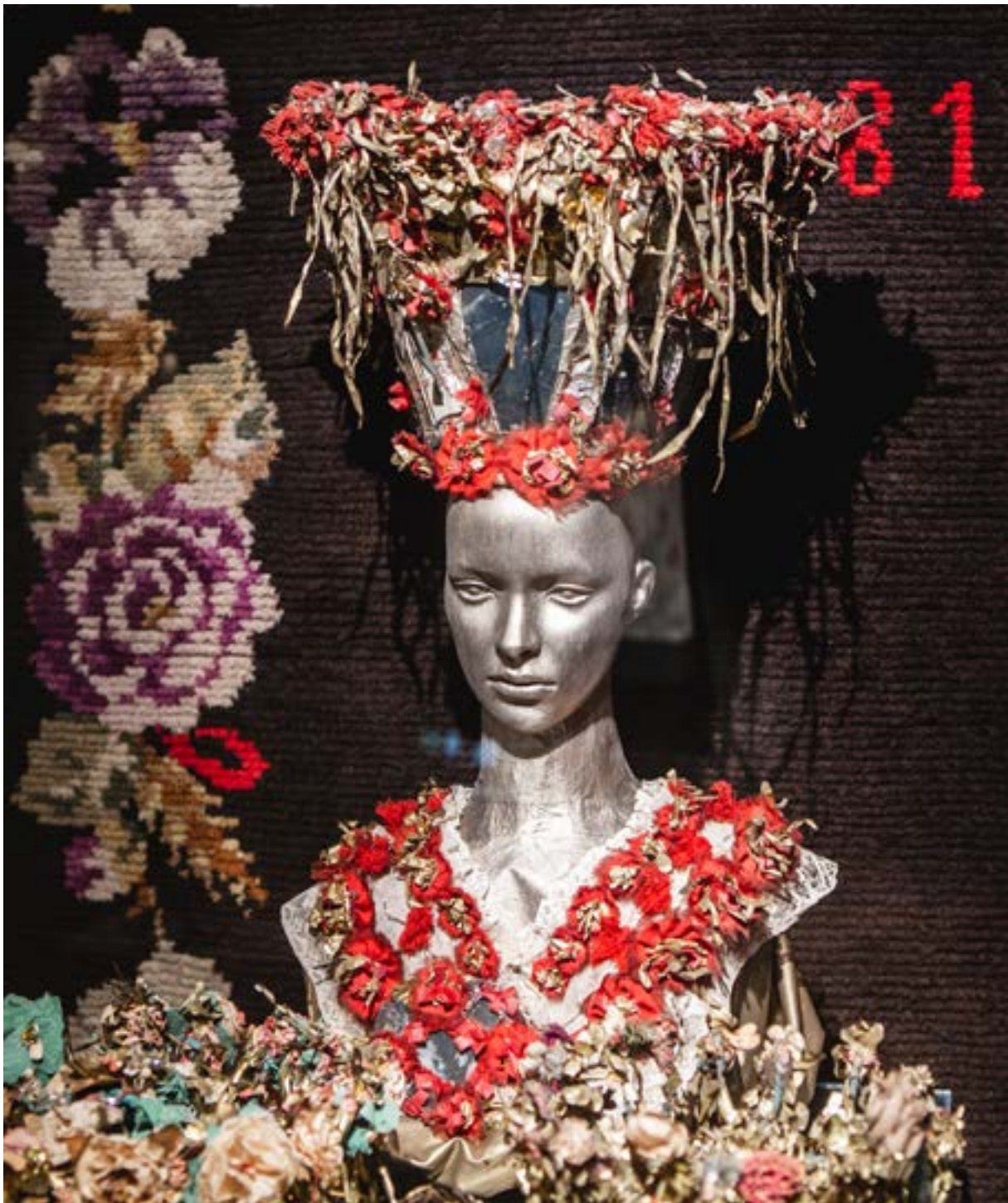
Häavetriini, Satakunnan Museon Elon merkkejä -näyttelyssä.