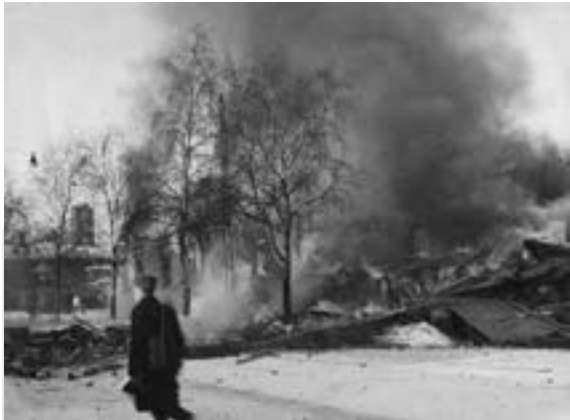
Porin pommitukset talvisodan aikana.