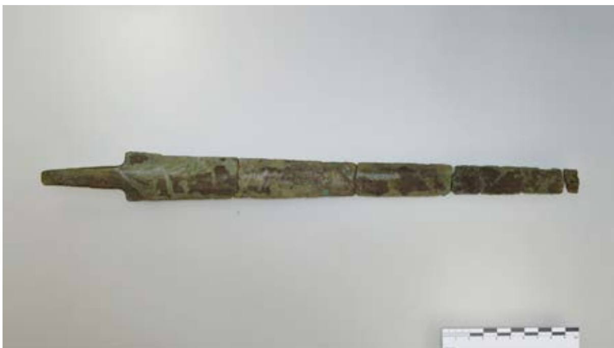
Paneliasta kesällä 2021 löydetty Saarion miekka saatiin lokakuussa esille museon perusnäyttelyyn.