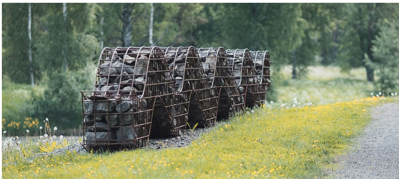
Oopperan käärme.

Oopperan käärme purettiin talkoilla kesällä 2020 ja kuljetettiin osina Helsingistä Kankaanpäähän. Noin kymmenen tonnia kiveä lastattiin suursäkkeihin ja käärmeen viisitoistametrinen runko katkaistiin kahteen osaan. Teos kuljetettiin nosturilla varustetulla kuorma-autolla. Perillä teos hitsattiin ehjäksi ja koottiin talkoovoimin. Oopperan käärmeen sijoituspaikaksi valikoitui Vuohiniitynpuisto, josta se näkyy myös Laviantielle; kantatielle nro 44.