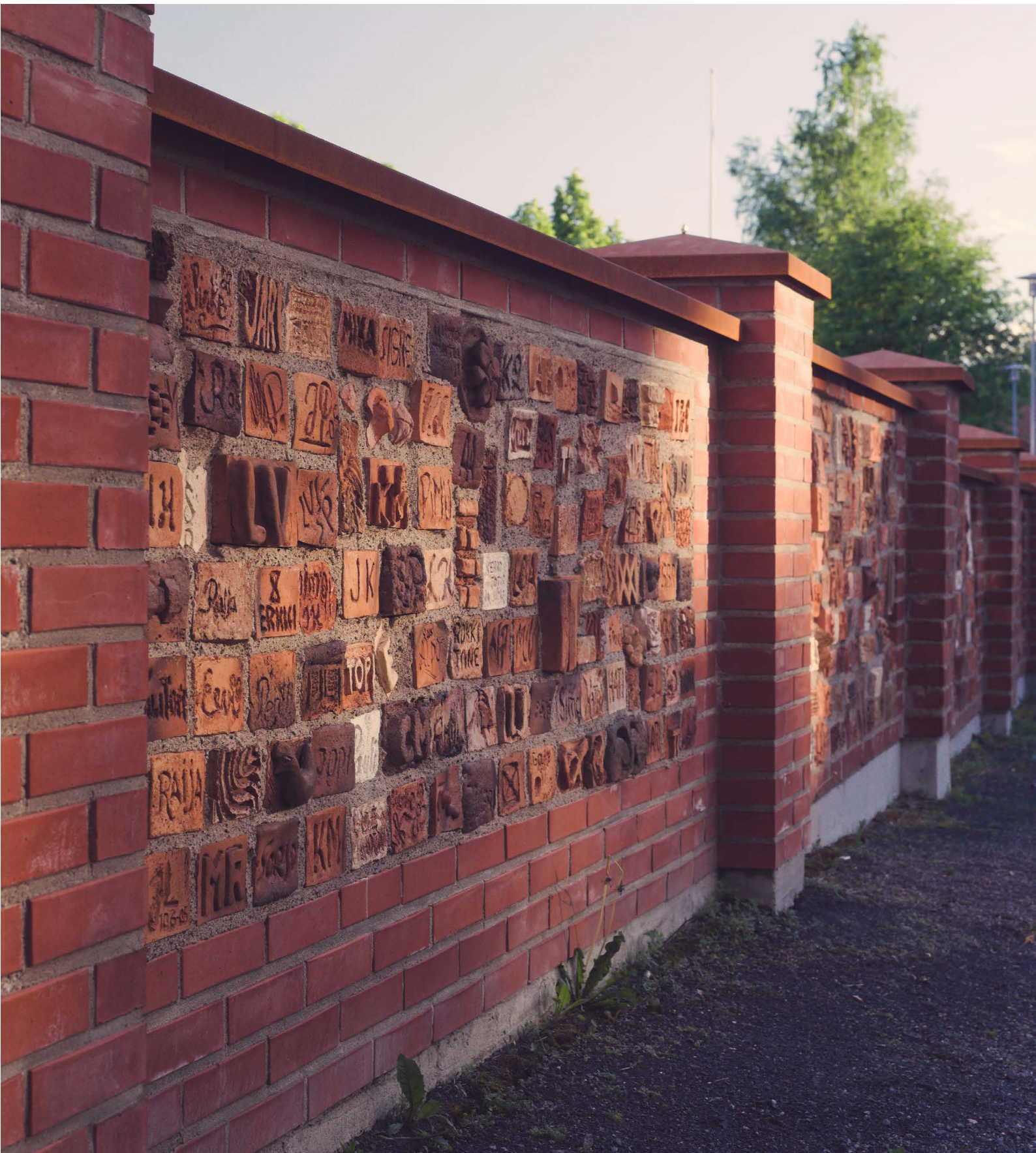
Kankaanpään Taidekehän teos Puumerkkitalimuuri koostuu taidetyöpajoissa satojen kaupunkilaisten käsin muovailemista tiilistä. Yhteisöllisen teoksen ideoi Liisa Juhantalo. Muurin toteutuksesta vastasi Kankaanpään Taideyhdistys ry mestarimuurarien talkoovalla ja hankkimalla rahoitusta eri tahoilta. Muuri kasvoi neljään otteeseen vuosina 2006, 2016, 2021 ja 2022 kaikkiaan 36 metrin pituiseksi.