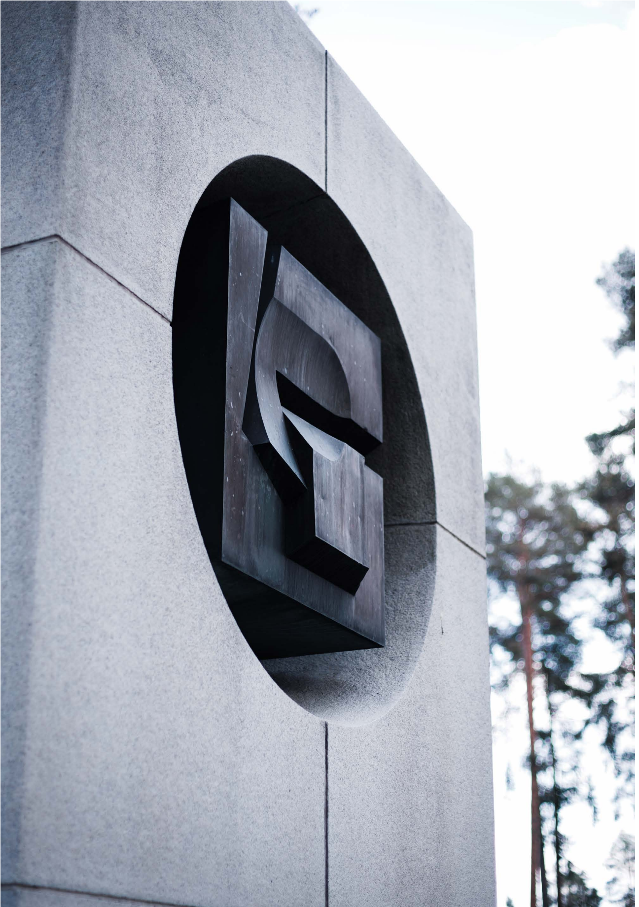
Kauko Räike: Sampo vuorossa, 1975, Kankaanpää.