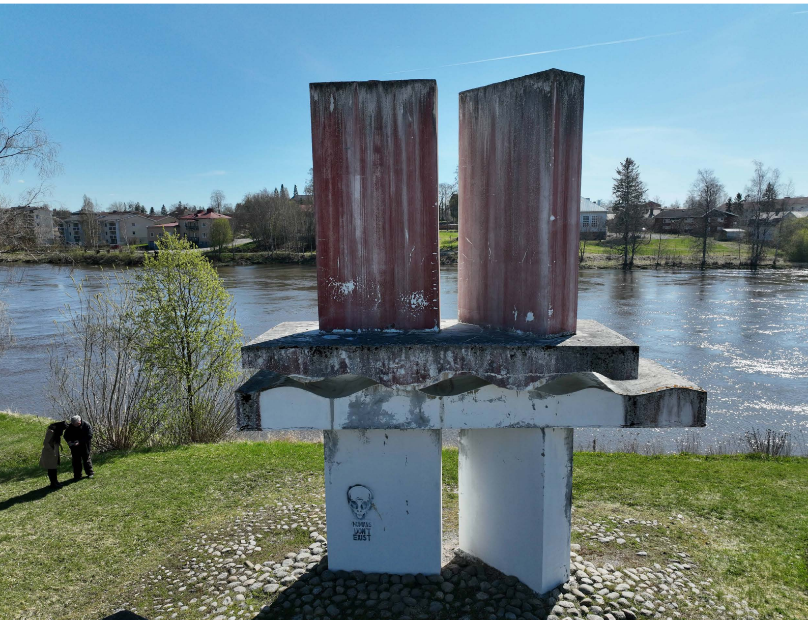
Koskenperkaajien muistomerkki vuonna 2023.