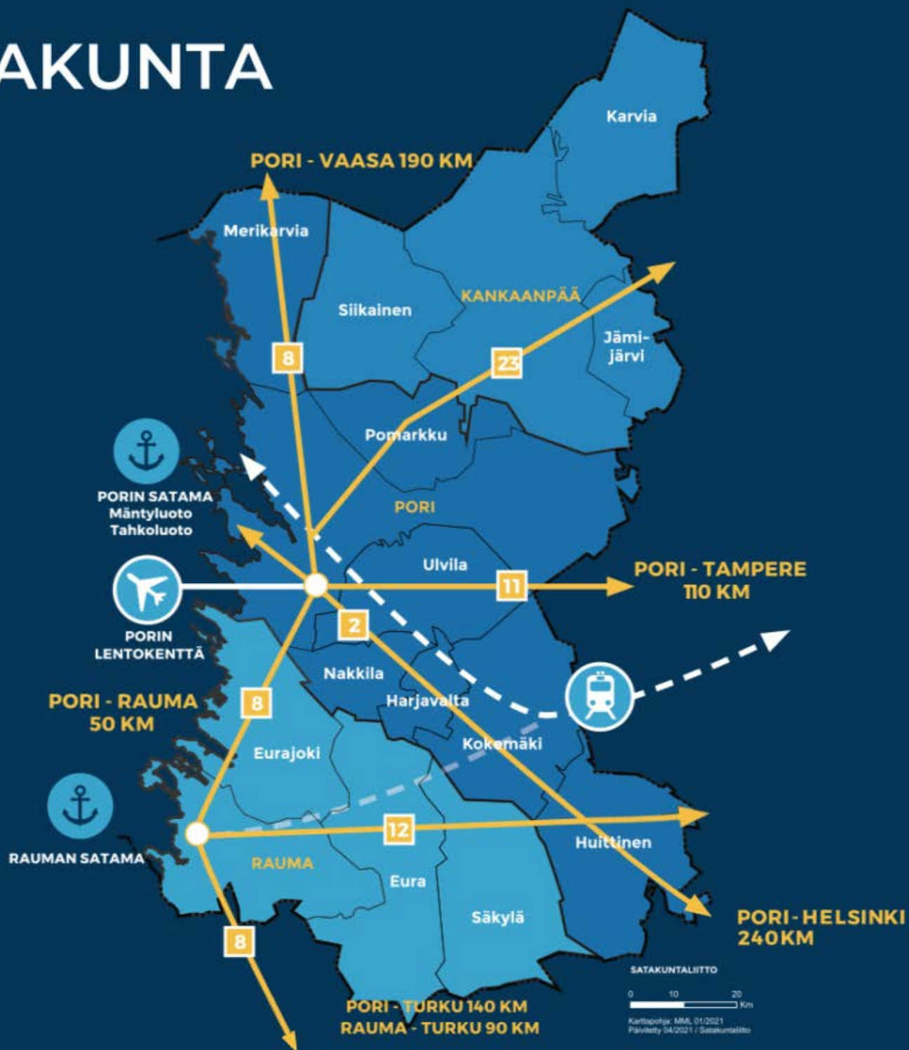
Satakunnan kartta.