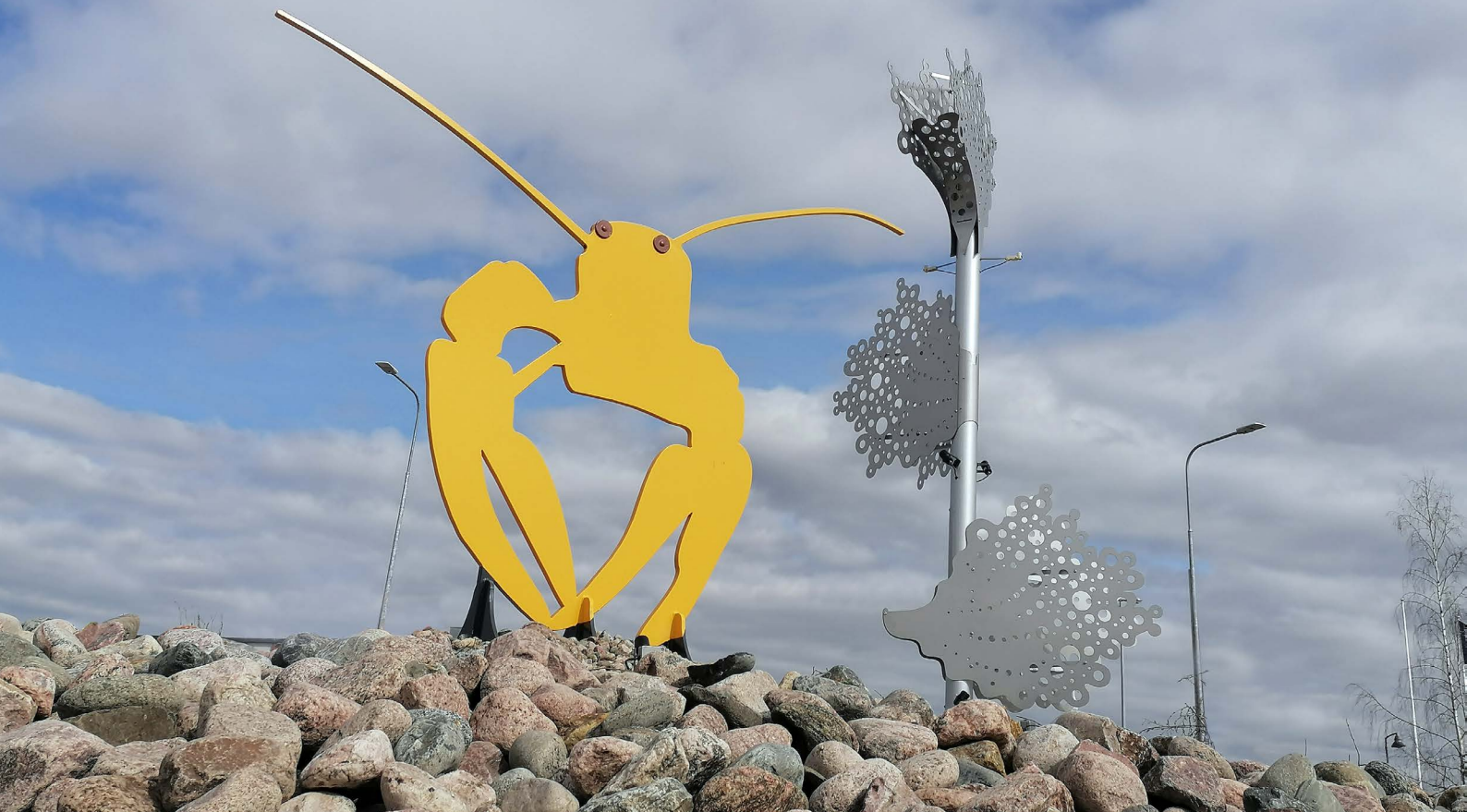
Mollu Heino ja Eurajoen 2. luokkalaiset: Merikrapu , 2023, Eurajoki.