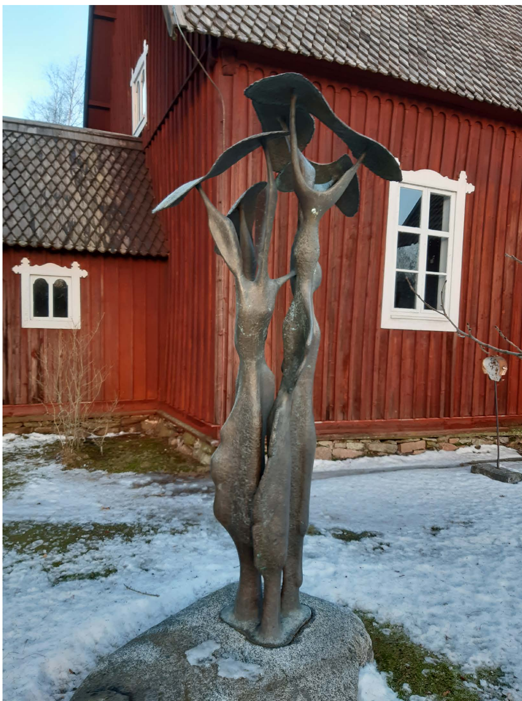
Marjatta Weckströmin veistos Elämänpuu on pystytetty Irjanteen kirkon kupeeseen vuonna 1981.

vasta Porin taidemuseosta. Taidemuseon henkilökunta antaa neuvontaa teosten huollossa. Etenkin ulkotiloissa sijaitsevia taideteoksia saatetaan töhriä, ja nopeasti tapahtuva töhrynpisto pienentää riskiä uusien töhryjen syntymiselle. Teokselle tehtävistä huoltotoimenpiteistä kannattaa pitää kirjaa, ja tiedot kannattaa säilyttää helposti löydettävässä paikassa esimerkiksi rakennuksen huolto-ohjeiden yhteydessä.