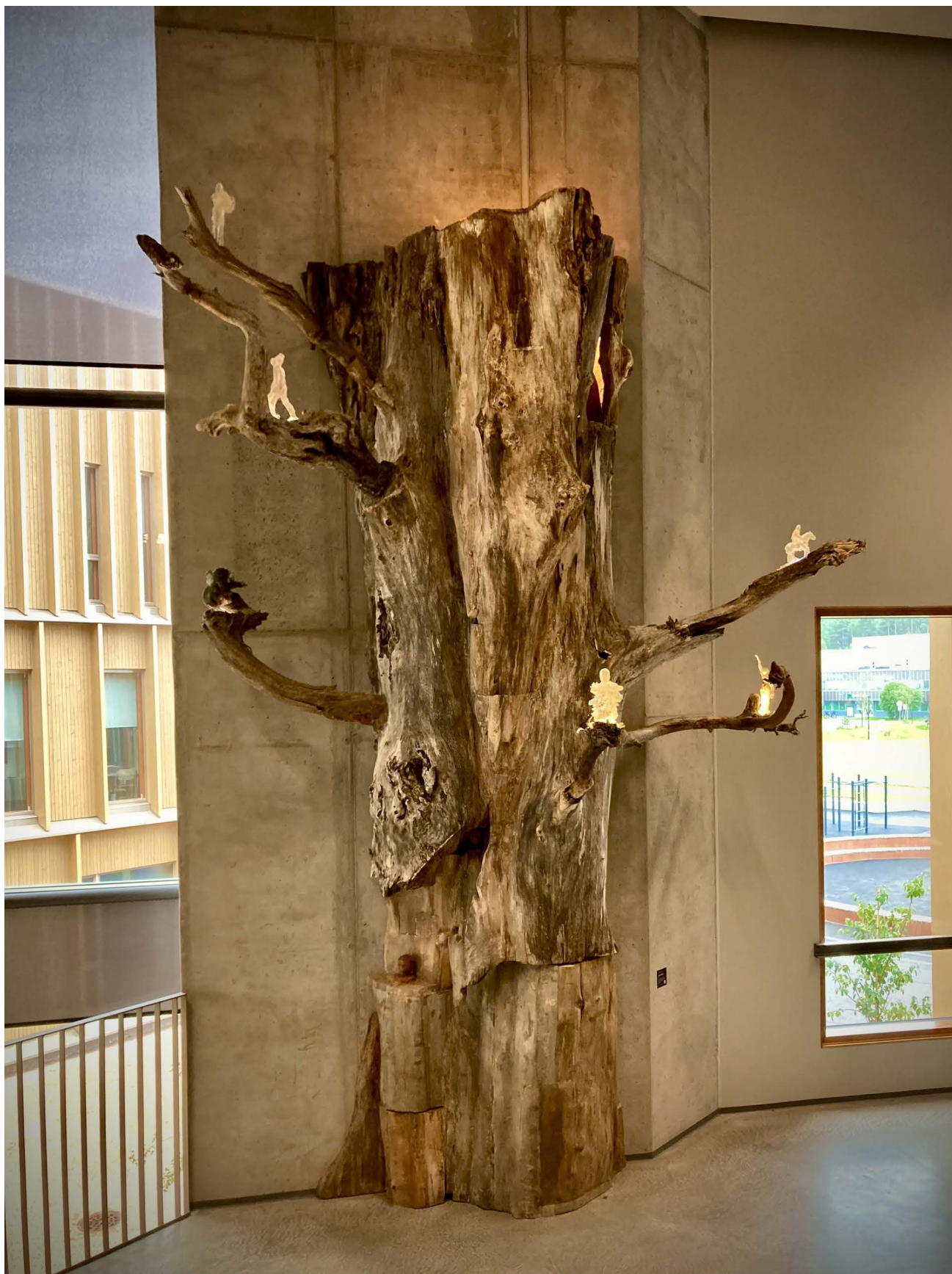
Paavo Paunu: Katedraali, 2024, Karin kampus, Rauma.