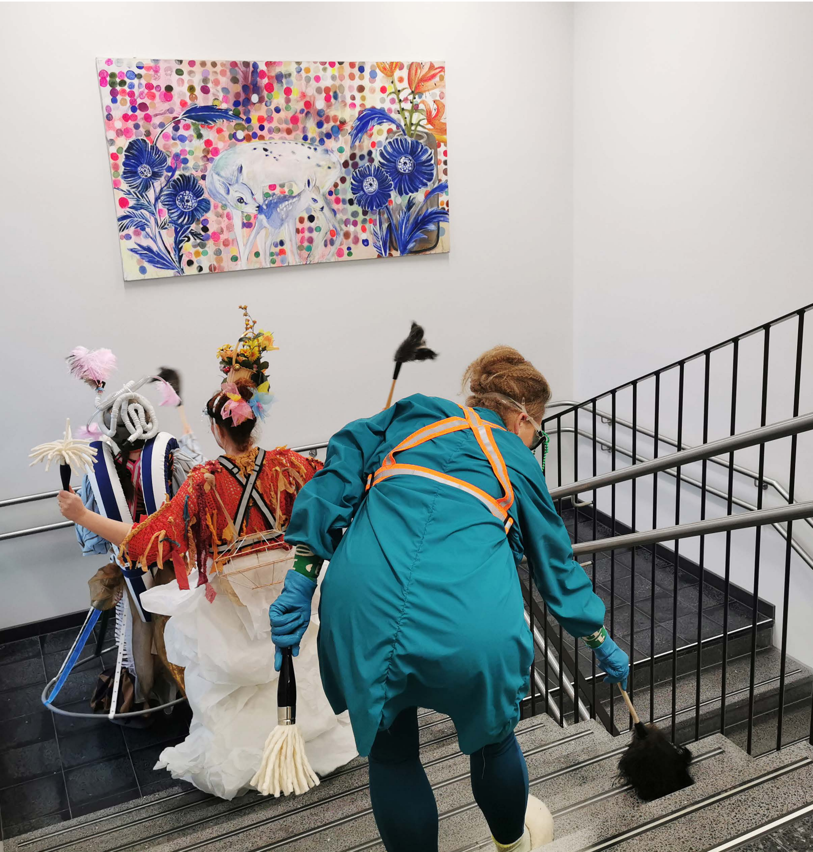
Piirakkakerhon performanssi.