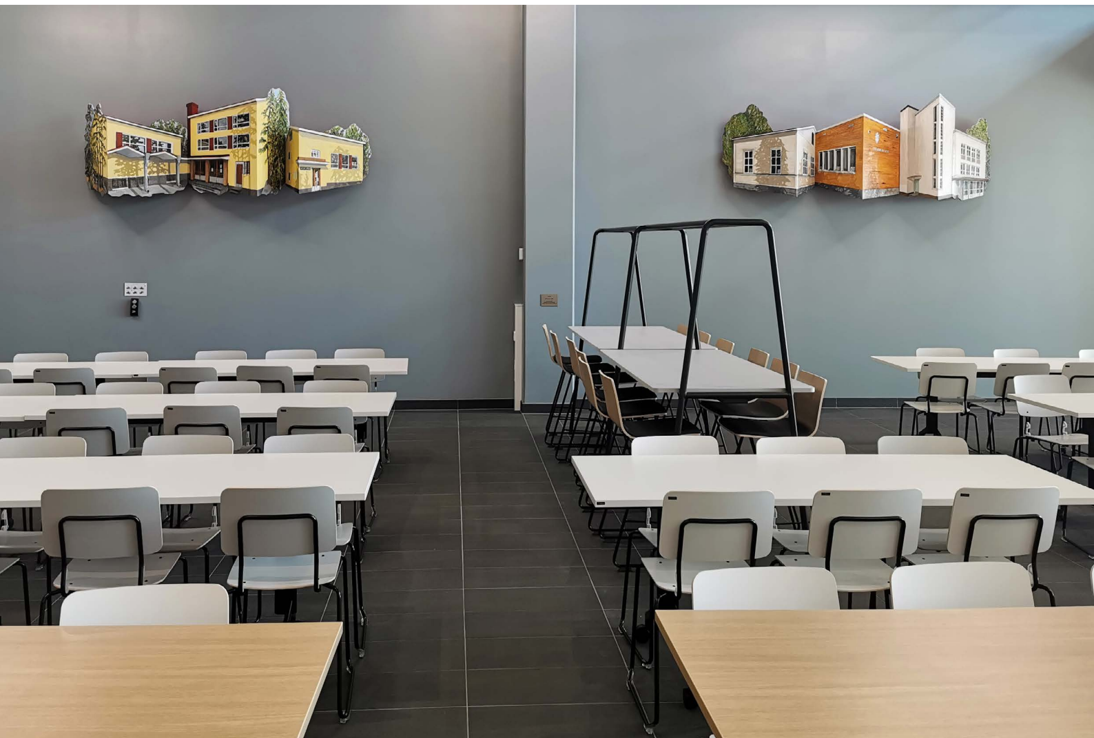
Jenni Yppärilä: 1+1=1 , 2023. Pohjoisväylän koulu, Pori.