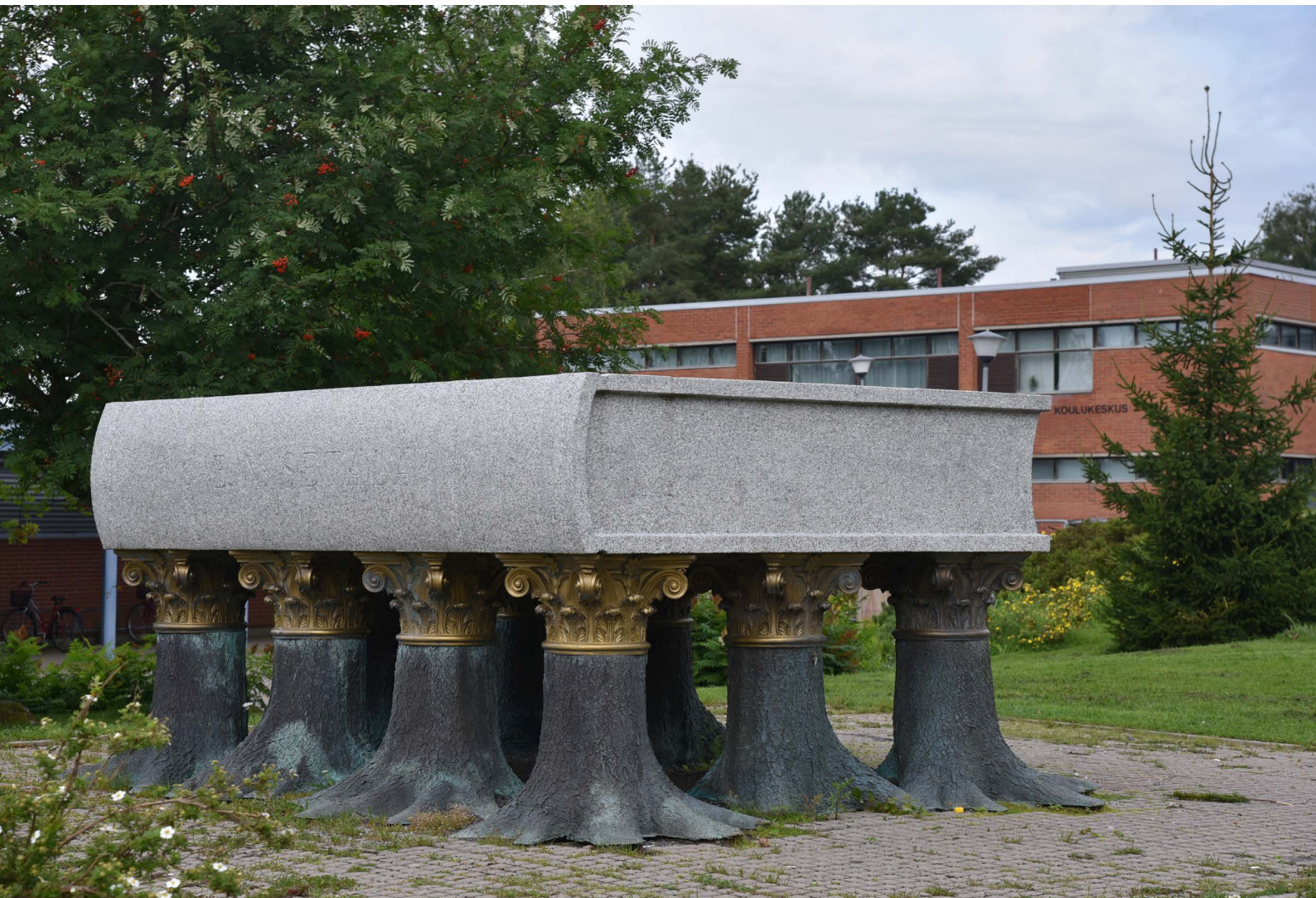
Lauri Astala: E. N. Setälän muistomerkki Kielioppi , 1998, Kokemäki.