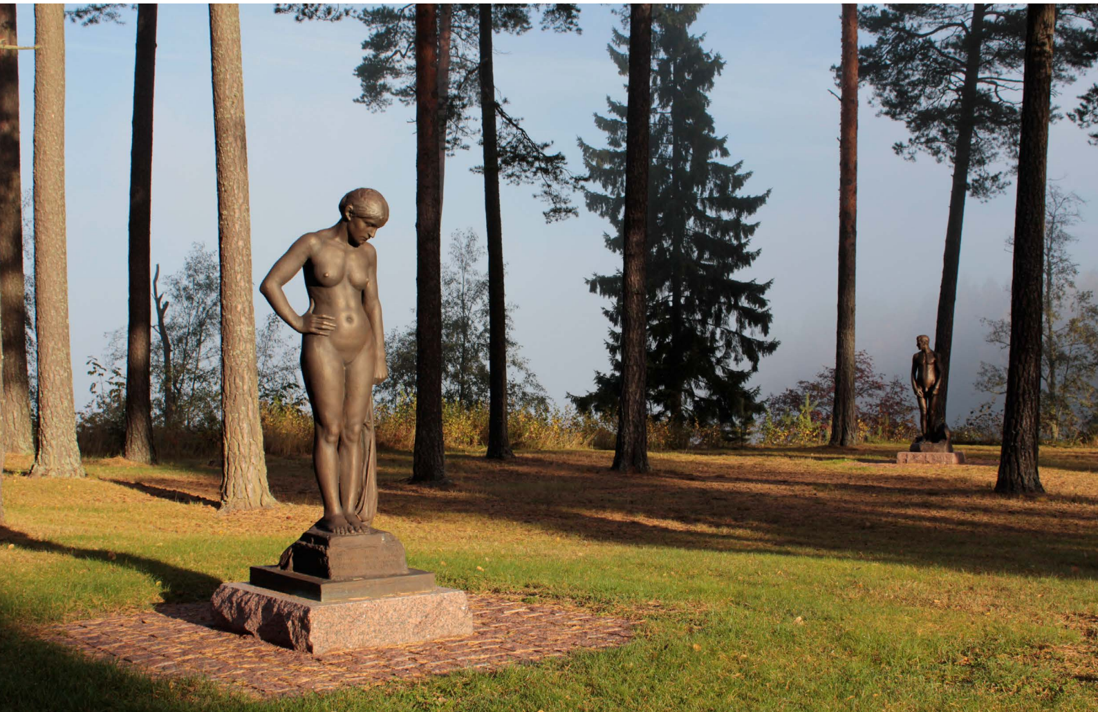
Emil Cedercreutz: Ensi kertaa mallina , 1903 ja taustalla Auringonlaskun aikaan , 1903, Emil Cedercreutzin museon veistospuisto.