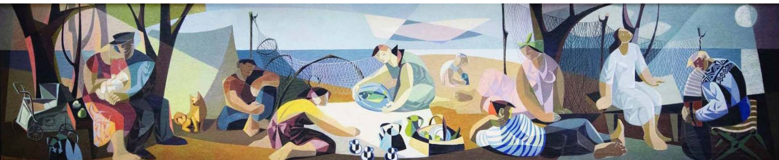
Birger Carlstedt: Aamusta iltaan , 1950.