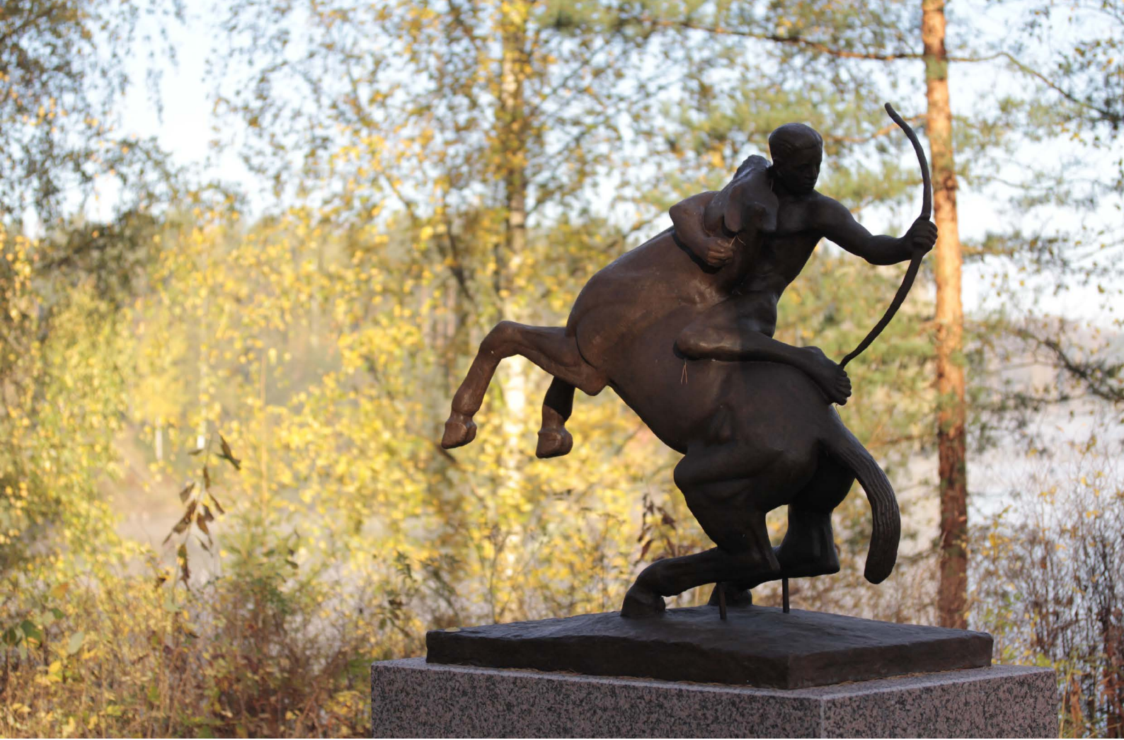
Emil Cedercreutz: Apollo jännittää jouta , 1924, Emil Cedercreutzin museon veistospuisto.