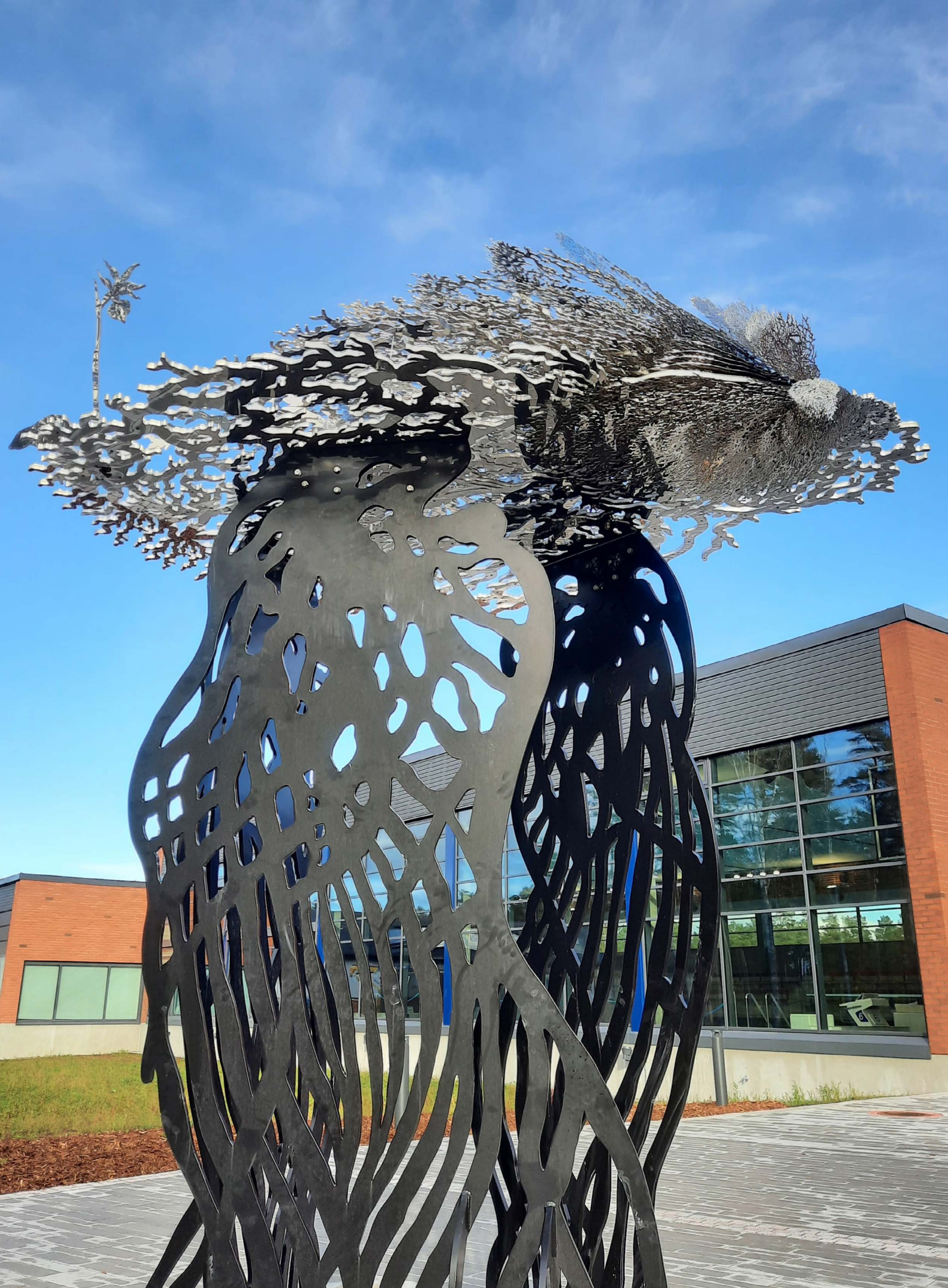
Kirsi Kaulanen: Pikkuapollo , 2022.