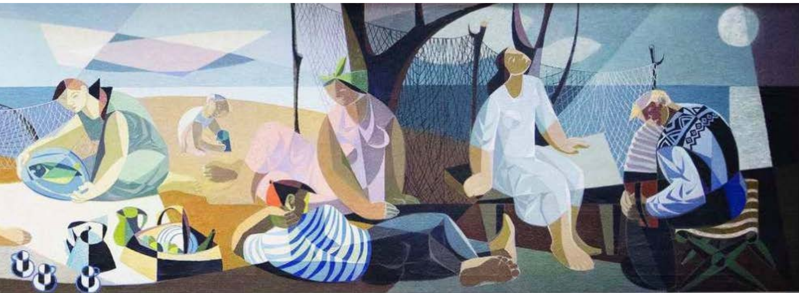
Birger Carlstedt: Aamusta iltaan, yksityiskohtia , 1950.