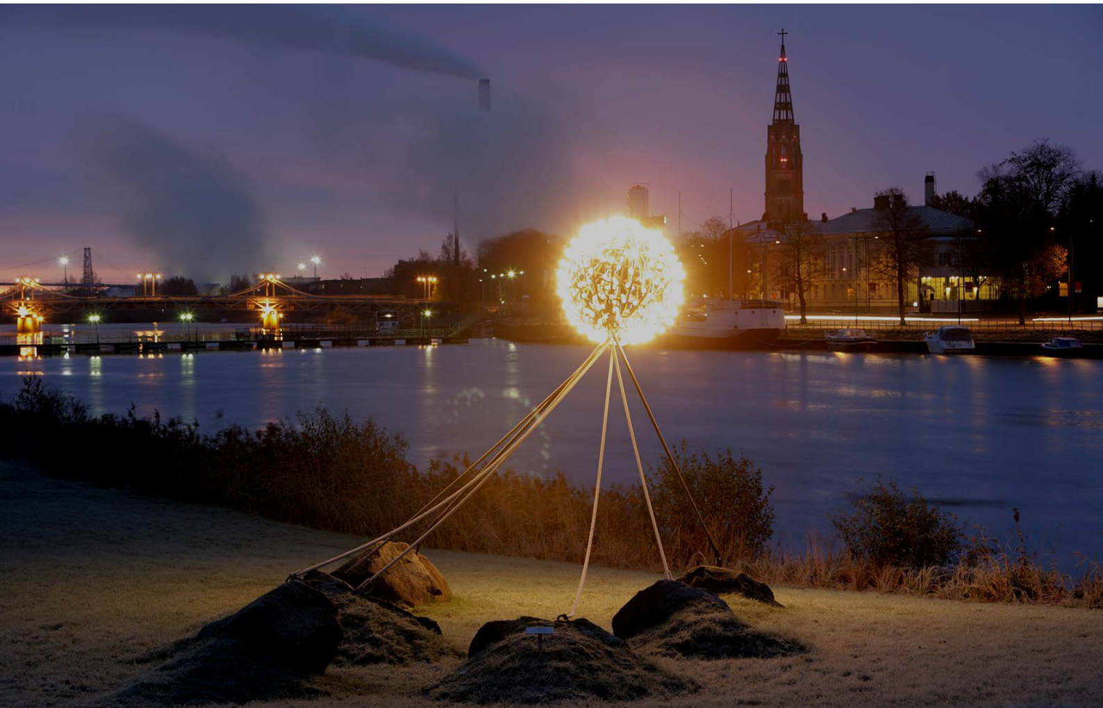
Taiteilijaryhmä Ynnä+: Vetovoima, 1999, Pori.