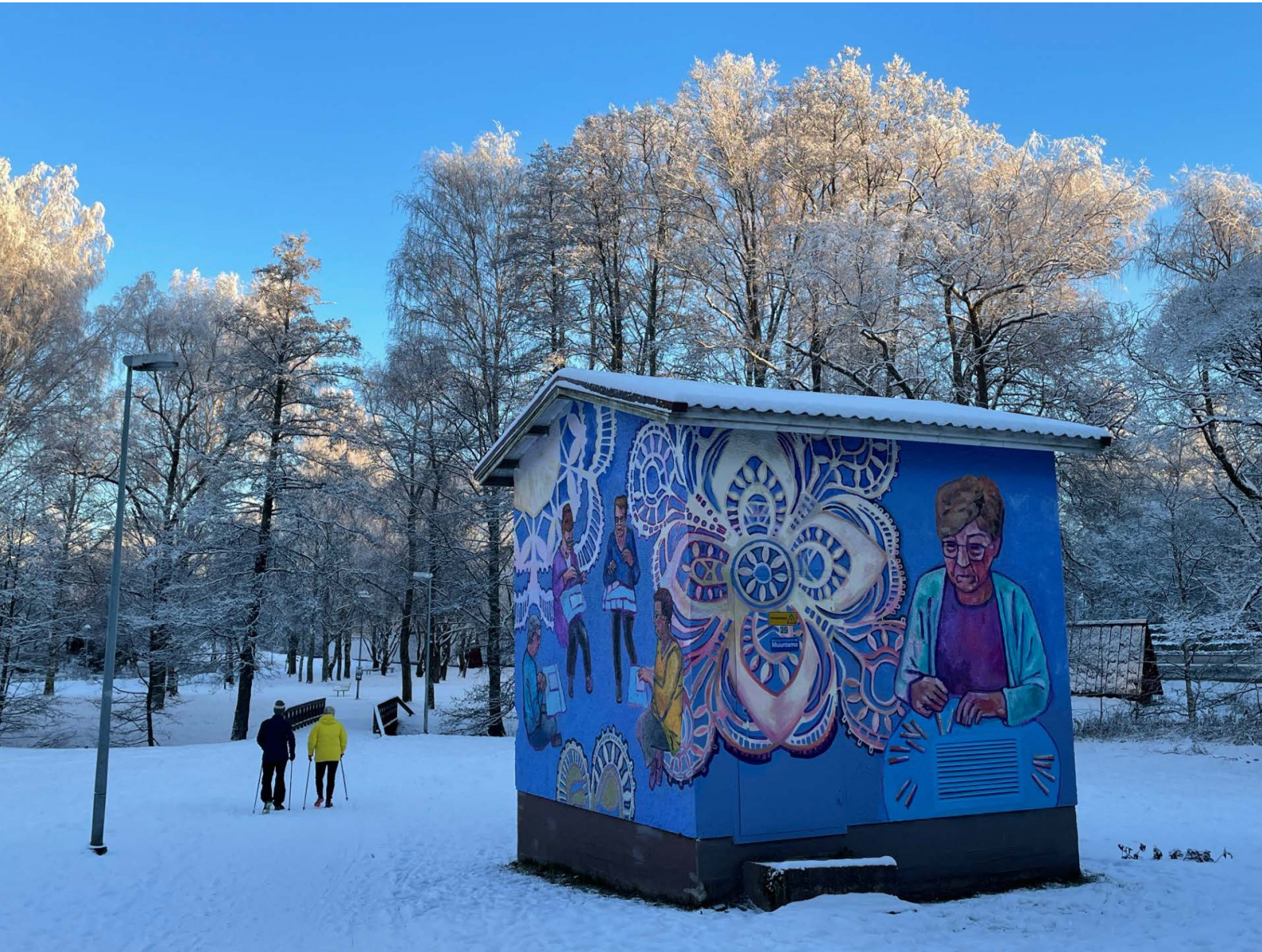
Seinämaalaus: Lella Byronin Pitsien ketjussa , Kaunisjärven puisto, Rauma.