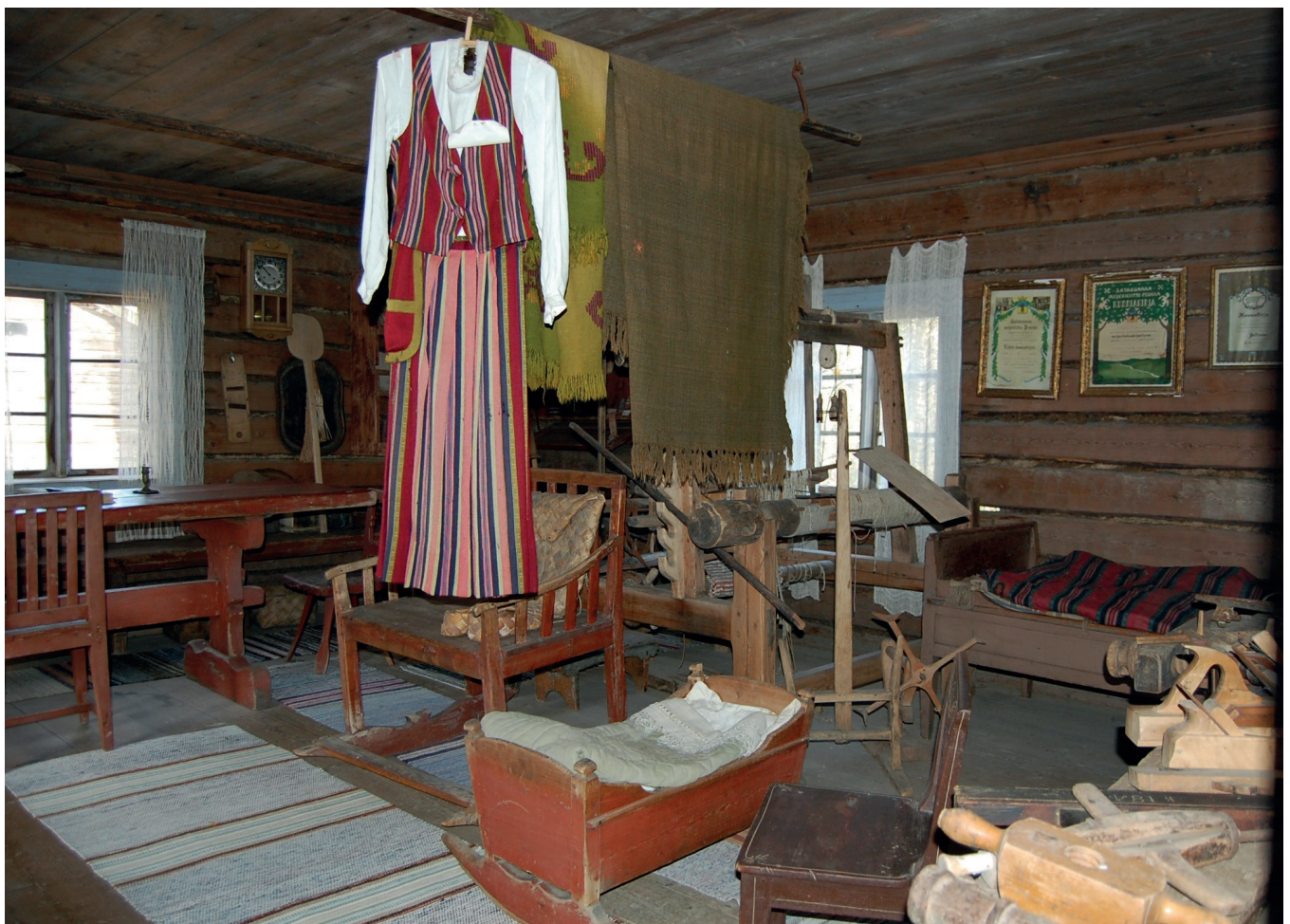
Sisäkuva museon pirtistä