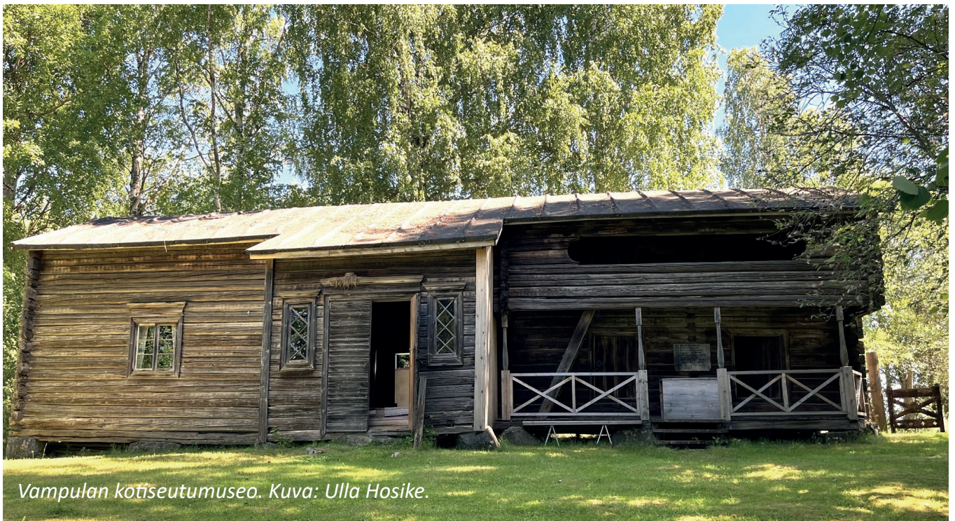
Vampulan kotiseutumuseo.