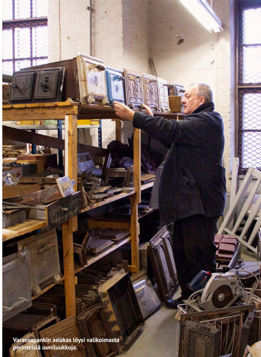
Varaosapankin asiakas löysi valikoimasta perinteisiä uuniluukkuja.