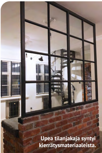
Upea tilanjakaja syntyi kierrätysmateriaaleista.