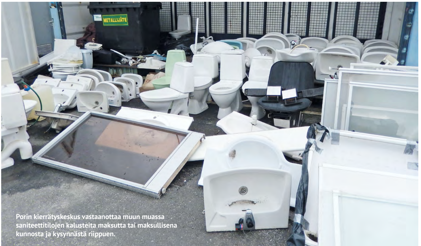
Porin kierrätyskeskus vastaanottaa muun muassa saniteettitilojen kalusteita maksutta tai maksullisena kunnosta ja kysynnästä riippuen.