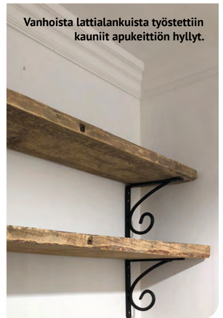
Vanhoista lattialankuista työstettiin kauniit apukeittiön hyllyt.