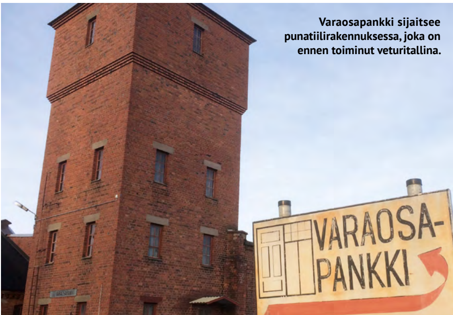
Varaosapankki sijaitsee punatiilirakennuksessa, joka on ennen toiminut veturitalina.