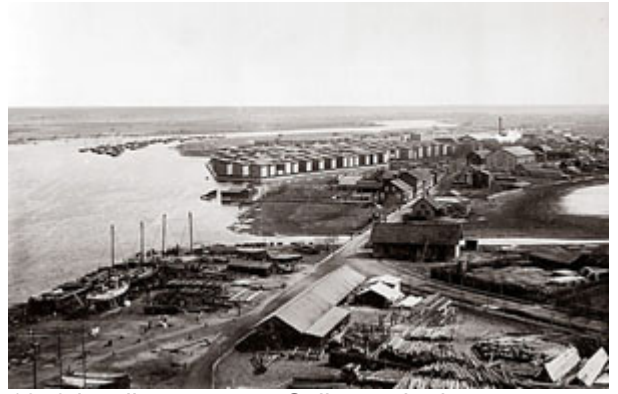
1870-luvulla perustettu Seikun saha kuvattuna vuosisadan vaihteessa.

Porin kehitys teollisuuskaupungiksi kiihtyi 1870-luvulla. Tulitikkutehdas oli perustettu jo vuonna 1851 ja konepaja seitsemän vuotta myöhemmin. Varsinaista suurteollisuutta Porissa olivat sahat, joita perustettiin 1800-luvun viimeisinä vuosikymmeninä useita. Sahateollisuuden tuotteet menivät pääasiassa vientiin, satamissa oli vilkas liikenne. Vuosisadan vaihteessa perustetun puuvillatehtaan tuotteilla haettiin menestystä kotimaan markkinoilla. Rautatie Tampereelta Poriin valmistui 1895. Kaupungissa vaikutti useita suomalaisia suurliikemiehiä ja liikemiessukuja kuten Ahlström ja Rosenlew. Porvarien vastapainona oli monilukuinen ja itsetietoinen teollisuustyöväki. Kaupungin asukasluku oli jo 12279.