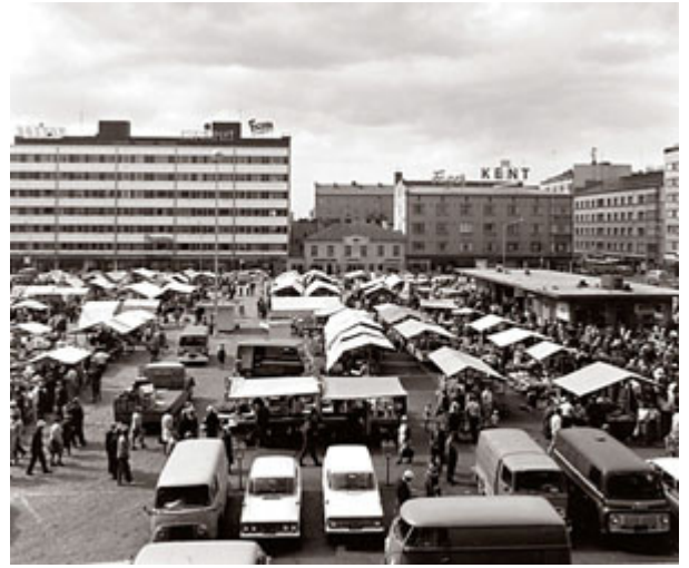
Kauppatorin laitaa 1960-luvulla. Keskustan näkymien järjestelmällinen dokumentointi toteutettiin tuolloin arkistointikelpoisina mustavalkokuvina.

Itsenäisyydenajan Suomessa Pori on ollut merkittävä, nopeasti kasvava suurteollisuuden ja satamien kaupunki. Rosenlew, Outokumpu, Rauma-Repola, Kemira ja muut teollisuuslaitokset tarvitsivat runsaasti uutta työväkeä, kaupunki kasvoi nopeasti. Poriin liitettiin maalaiskunta ja vuonna 1972 Ahlaisten kunta. Kaupungin ilme muuttui perusteellisesti : uusia kaupunginosia nousi ydinkeskustan ympärille, ja vanhan keskustan puurakennukset väistyivät uusien kerrostalojen tieltä. Perinteisiä puutaloalueita jäi Viidenteen ja Kuudenteen kaupunginosaan. Matka idylliseen Reposaareen tuli helpommaksi, kun merenlahtien yli rakennettiin pengertie 1950-luvun lopulla. Uusi aika toi uudet kulttuurituulet. Pori jazzista kasvoi muutamassa vuodessa menestyvä kansainvälinen festivaali, suomalainen rock on usein ollut porilaista. Urheilussa kaupunki opittiin tuntemaan menestyvistä voimamiehistään ja Suomen mestaruuksia voittaneista palloilujoukkueista.