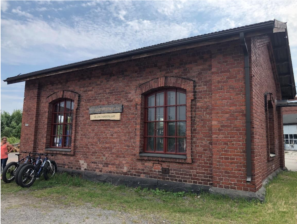
Kuva 3 Luontopajan Välinevuokraamo toimii Veturitallien alueella.