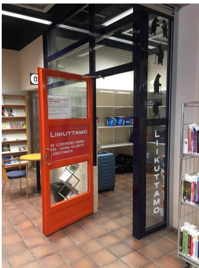
Kuva 1 Porin pääkirjaston Liikuttamo.

Porin pääkirjaston aulassa toimii Liikuttamo, josta voi lainata kirjastokortilla monenlaisia liikunta- ja retkeilyvälineitä, kuva 1. Liikuttamo palvelee kirjaston aukioloaikojen mukaisesti.