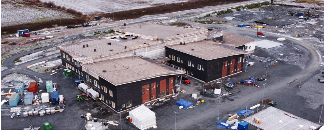
Drone-kuva työmaan länsipuolelta 18.11.2022

Maanrakennustyöt jatkuvat urheilukentillä.