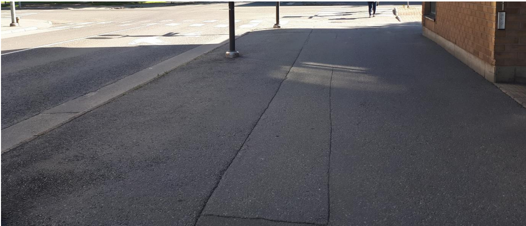
Kuva 3. Kävely- ja pyöräilyväylällä teoksen toteutukseen käytettävissä olevia pintoja: