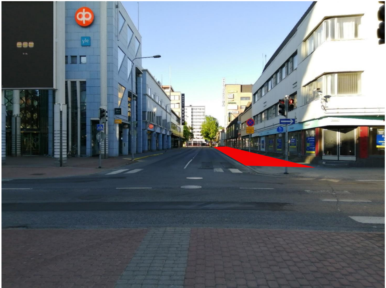
Kuva 2. Teoksen toteutusalueena on kävely- ja pyöräilyväylä Yrjönkadulla (rajattu punaisella). Näkymä Porin kävelykadulta. (Kuva: Sari Kivioja).