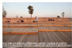
'Laituri' ravintolatoiminnalle ja oleskeluun