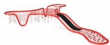
Yksi arkkitehtuurinen leikkiväline