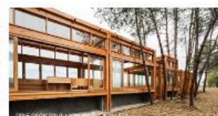
2-kerroksinen ravintola / kioski / terassi