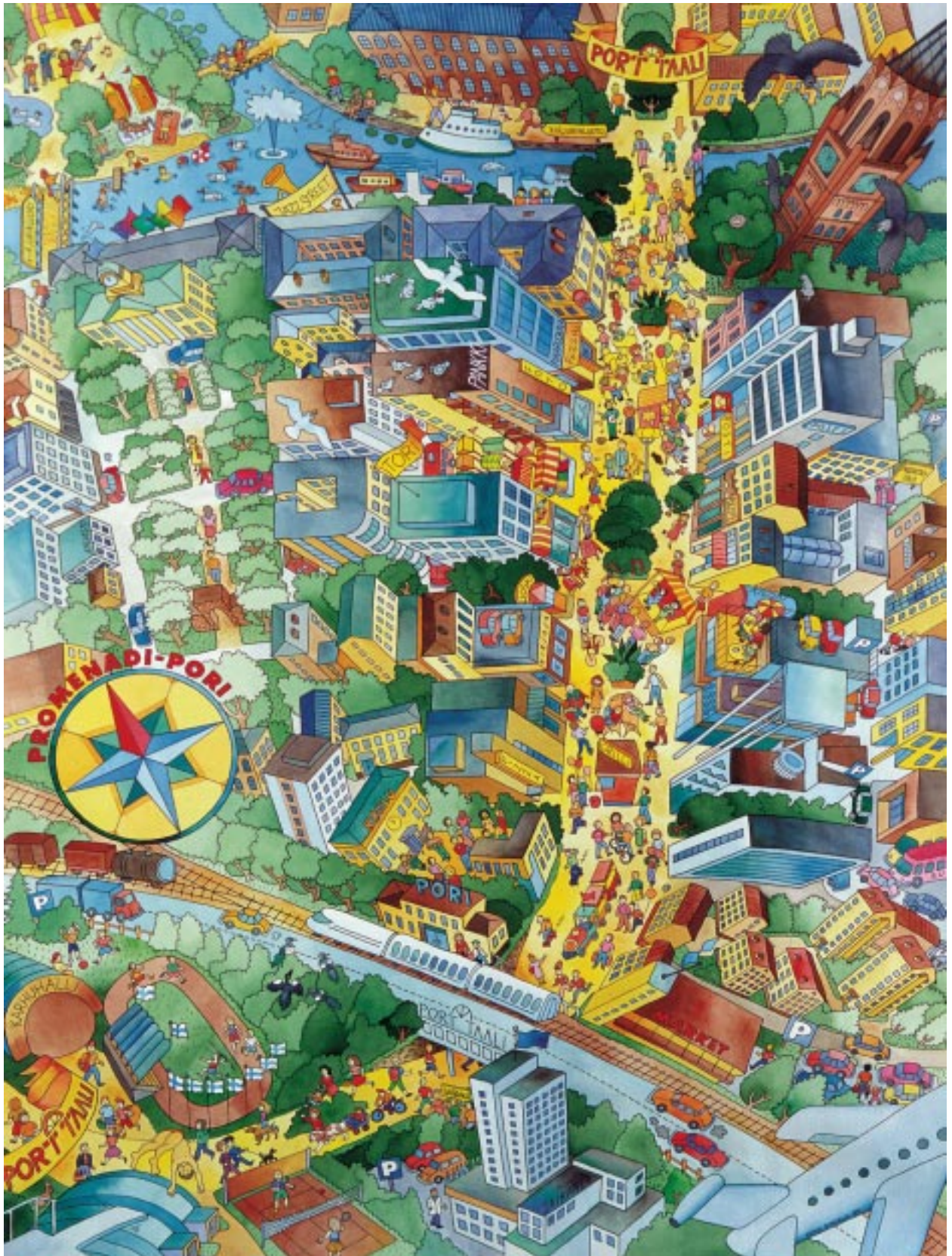
PROMENADI-PORI KAUPUNKIKESKUSTAPROJEKTI 2000