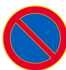
C38 PYSÄKÖINTI KIELLETTY