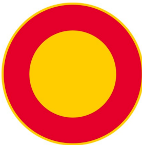
C1 AJONEUVOLLA AJO KIELLETTY