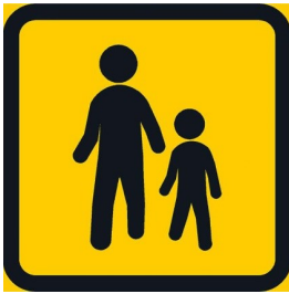
F52 JALANKULKIJALLE TARCOITETTU REITTI KOHDE NUOLEN SUUNNASSA