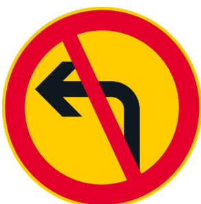
C18 VASEMMALLE KÄÄNTYMINEN KIELLETTY