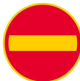
C17 KIELLETTY AJOSUUNTA