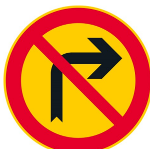
C19 OIKEALLE KÄÄNTYMINEN KIELLETTY