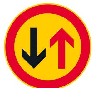
B4 VÄISTÄMISVELVOLLISUUS KOHDATAESSA