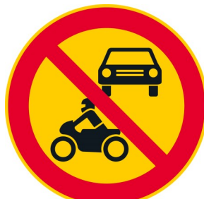
C2 MOOTTORIKÄYTTÖISELLÄ AJONEUOVOLLA AJO KIELLETTY