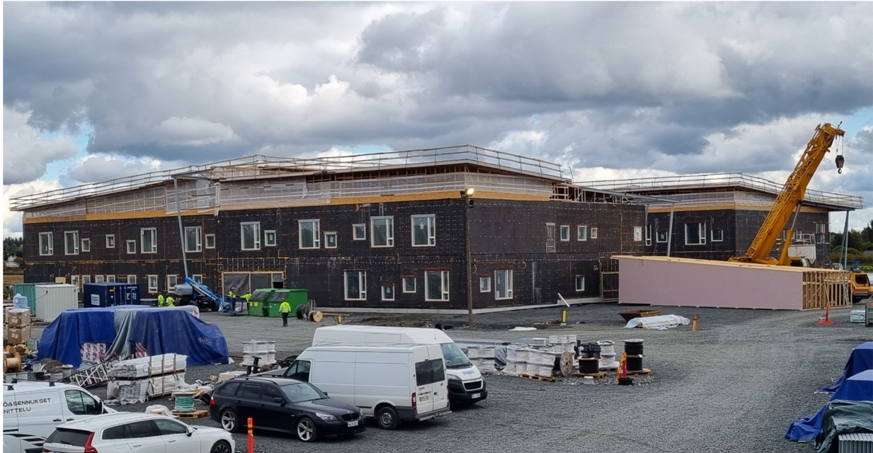
Kuva työmaatoimiston portaalta 23.9.2022.

Maanrakennustöitä jatketaan urheilukentillä, etelän kaapeliputkituksilla ja pohjoispuolen reunatäyttöjen osalla. Tällä hetkellä työmaalla työskentelee yksi kaivinkoneryhmä.