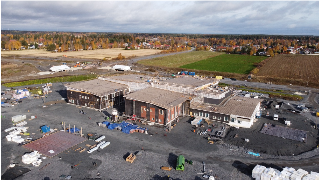
Kuva eteläsuunnasta 13.10.2022.

Maanrakennustyöt jatkuvat urheilukentillä ja pohjoispuolen reunatäyttöjen osalla kahdella kaivinkoneryhmällä ja dumperilla. Lähiviikkoina asennetaan eteläpuolelle ulko-opetustilan katsomon betonielementit.