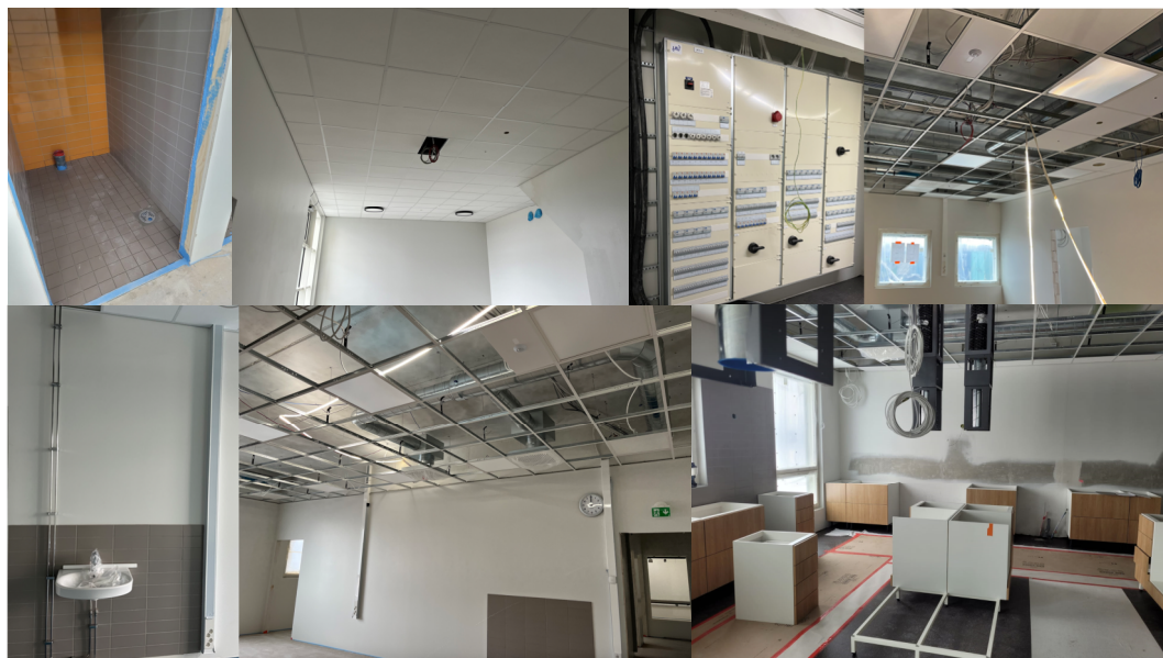
Kuvia työmaalta 16.4.2024 ja 23.4.2024