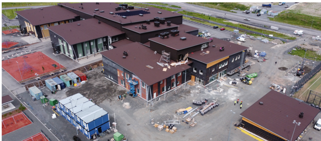
Dronekuva työmaalta 6.6.2024