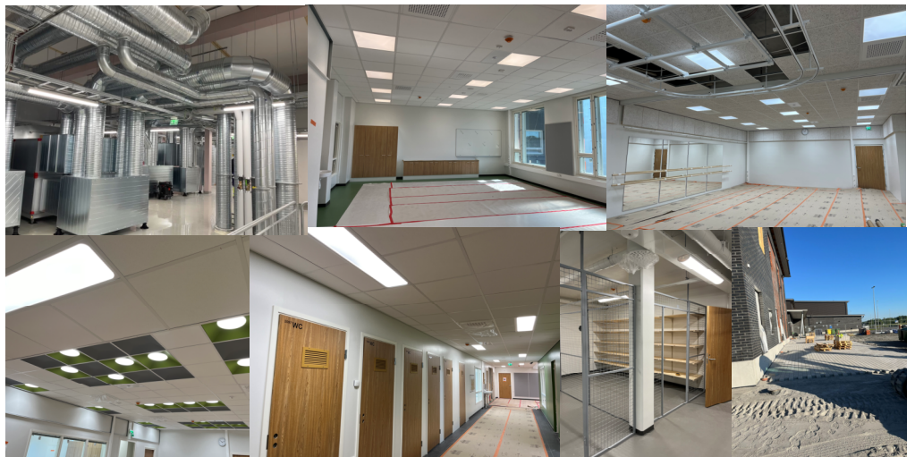
Kuvia työmaalta 26-27.6.2024

Kesällä löytyy monenlaista teke- mistä ja nähtävää läheltä!