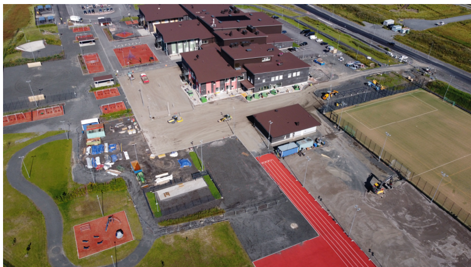
Dronekuva työmaalta 7.8.2024

Porin tapahtuma- kesä jatkuu vaan, ohjelmaa kaikenikäisille!