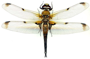
Ruskoukkokorento ( Libellula quadrimaculata ) Four-spotted Chaser Fyrrfläckad trollslända

Preiviikinlahden osittain ruovikkoiset rannat, suojaiset venevalkamat ja puoliavoimet niityt luovat suotuisan elinympäristön merenlahdilla viihtyville korentolajeillemme. Tuulettomat ja suojaiset paikat ovat edellytys sudenkorentojen ravinnon hankinnalle. Preiviikinlahdella elää noin kaksikymmentä Suomen yhteensä 55 sudenkorentolajista. Hoikkatytönkorentoa voidaan pitää alueen lajiston tyyppiesimerkkinä. Se on pääosin rannikkolaji ja viihtyy erityisesti ruovikkoalueilla. Ruskoukkokorento on Suomen yleisimpiä korentolajeja, ja esiintyy runsaana monenlaisissa ympäristöissä.