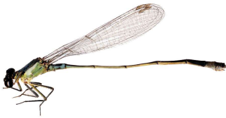
Hoikkatytönkorento ( Ischnura elegans ) Blue-tailed Damselfly Allmän kustfläckslända